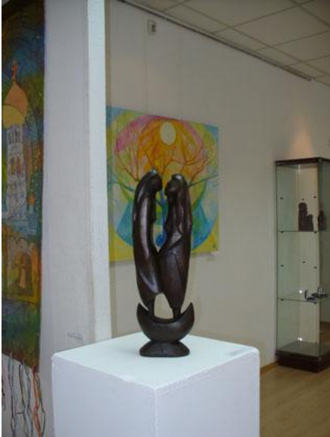
Этнофутуристический фестиваль «Три напева о России и Югре» г. Москва 2008 г.