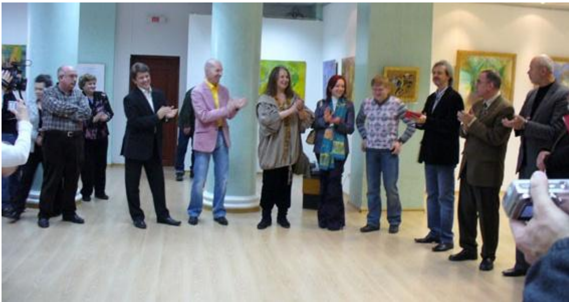
Этнофутуристический фестиваль «Три напева о России и Югре» г. Москва 2008 г.