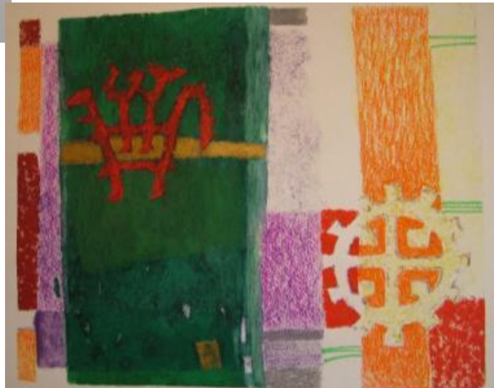
«Югра-большое гнездо» Дмитрий Медведев г. Нижневартовск