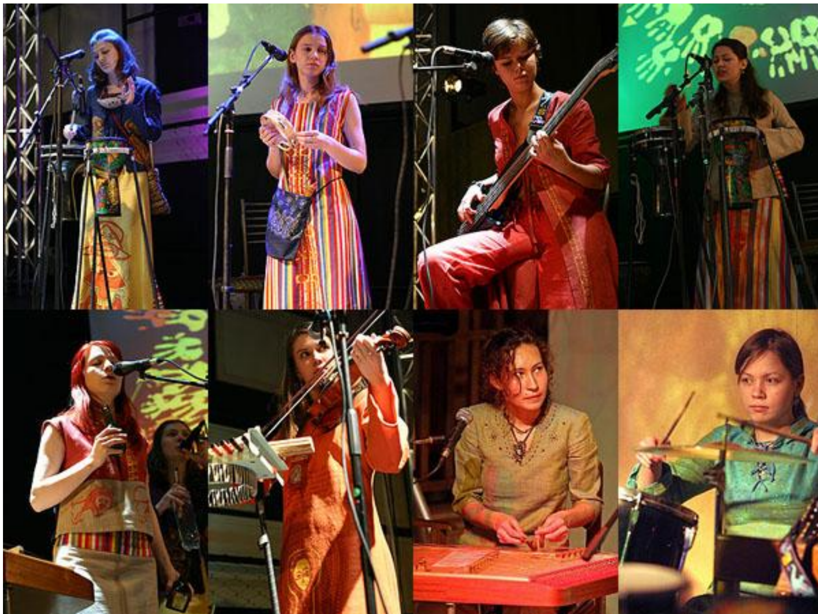
Ансамбль «Тыло Бурдо» г. Ижевск. В репертуаре, как обработки народных мелодий, так и авторские произведения. Девушки не только безукоризненно владеют вокальным многоголосием, но и играют на всевозможных инструментах.