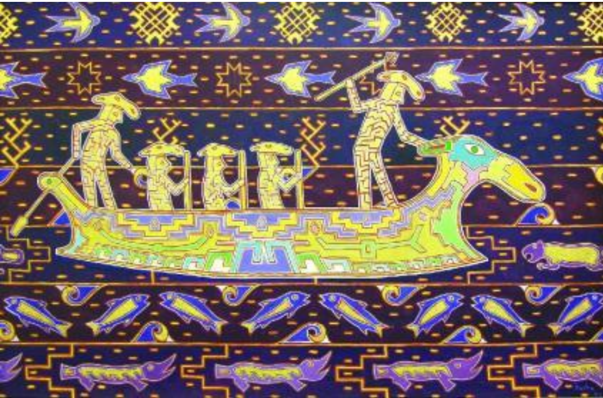
«На охоту» Павел Микушев г. Сыктывкар