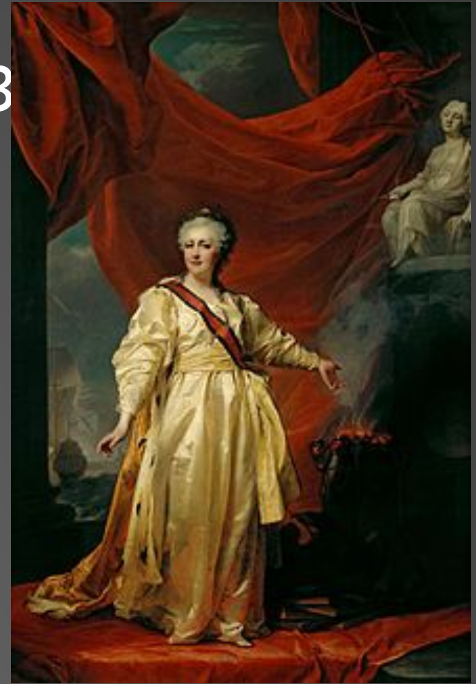
Дмитрий Левицкий. «Екатерина II в виде Законодательницы в храме богини Правосудия»