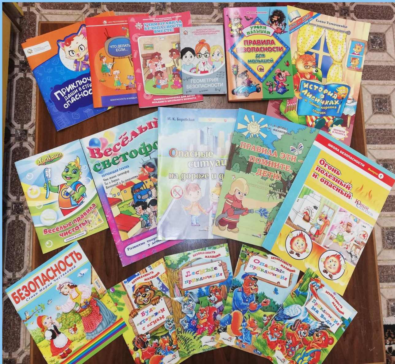
Детская художественная литература по тематике