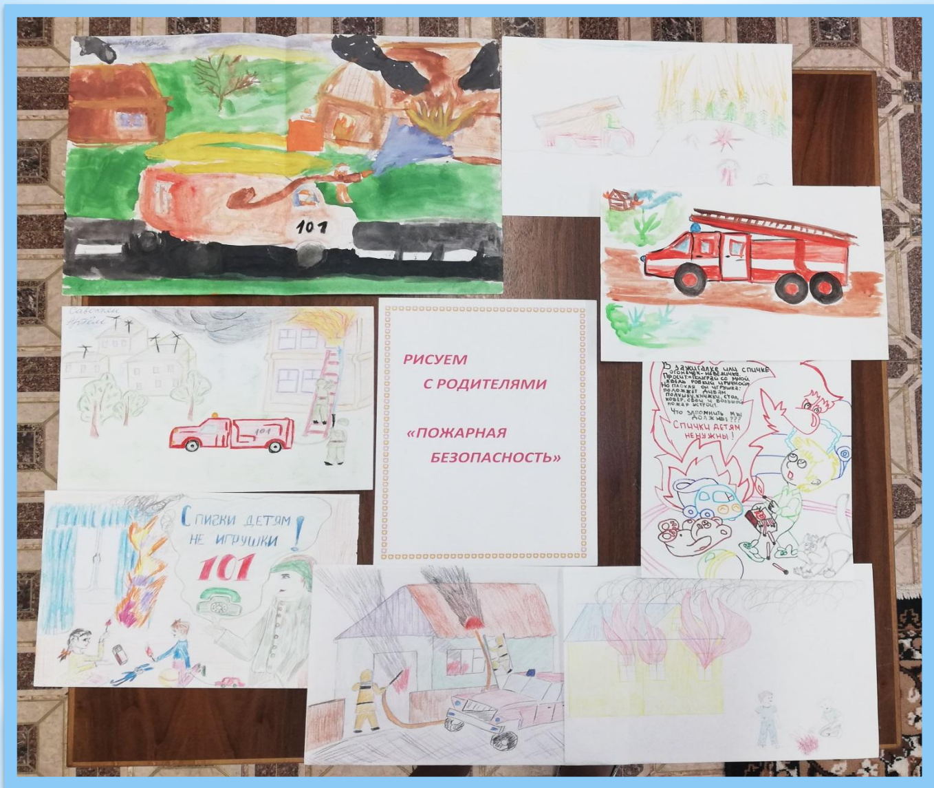
Действующая выставка рисунков