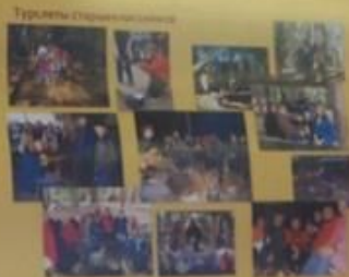
Турелье старинных городов