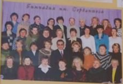
Бандажа на Сербанова