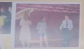
Весна на Константинов