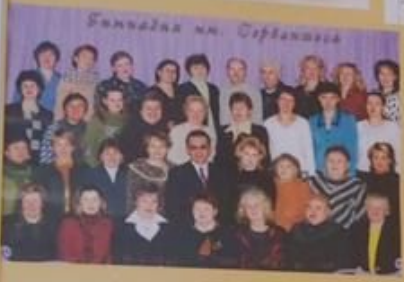
Бандажа на Сербанова