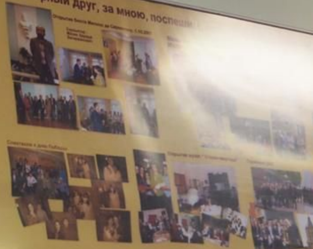
Семейство в день Работника