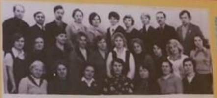
1977г. Мы начинали...