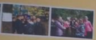
ИНО В ПЯТИКЛАСНИКИ