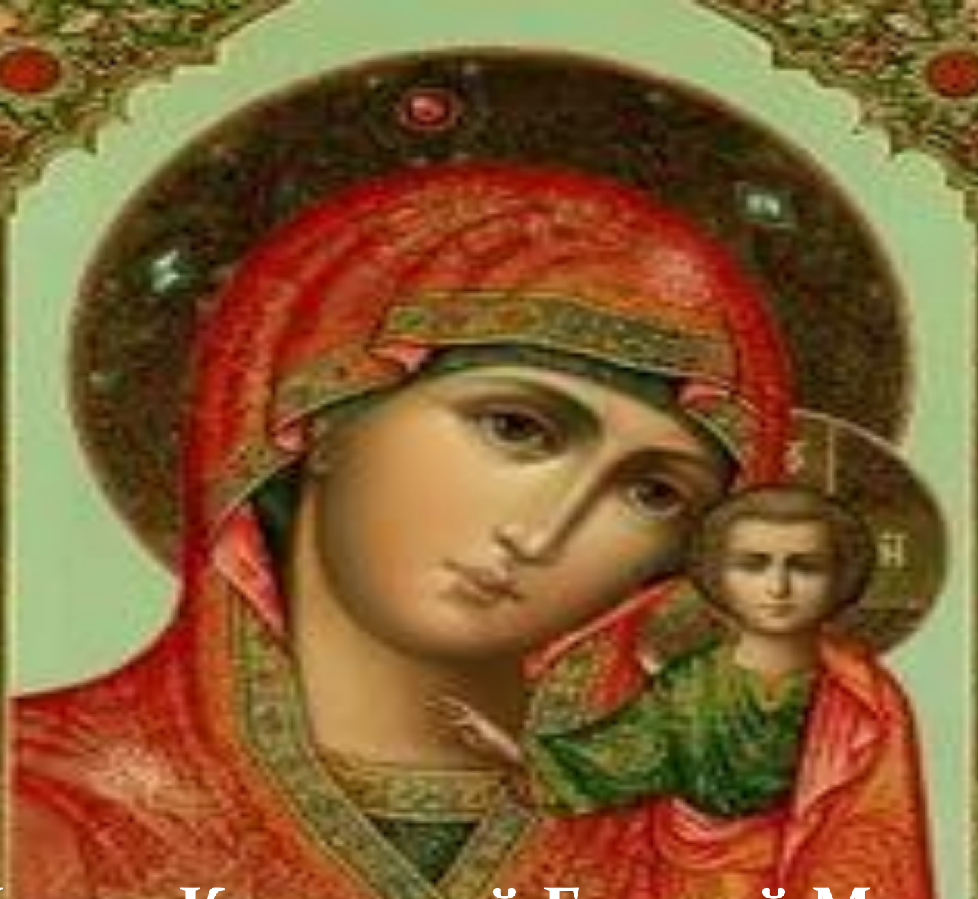
Икона Казанской Божьей Матери