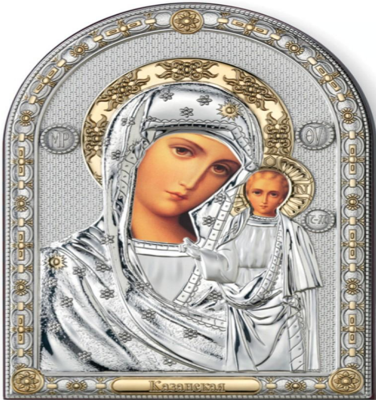
Казанская Икона Божьей Матери