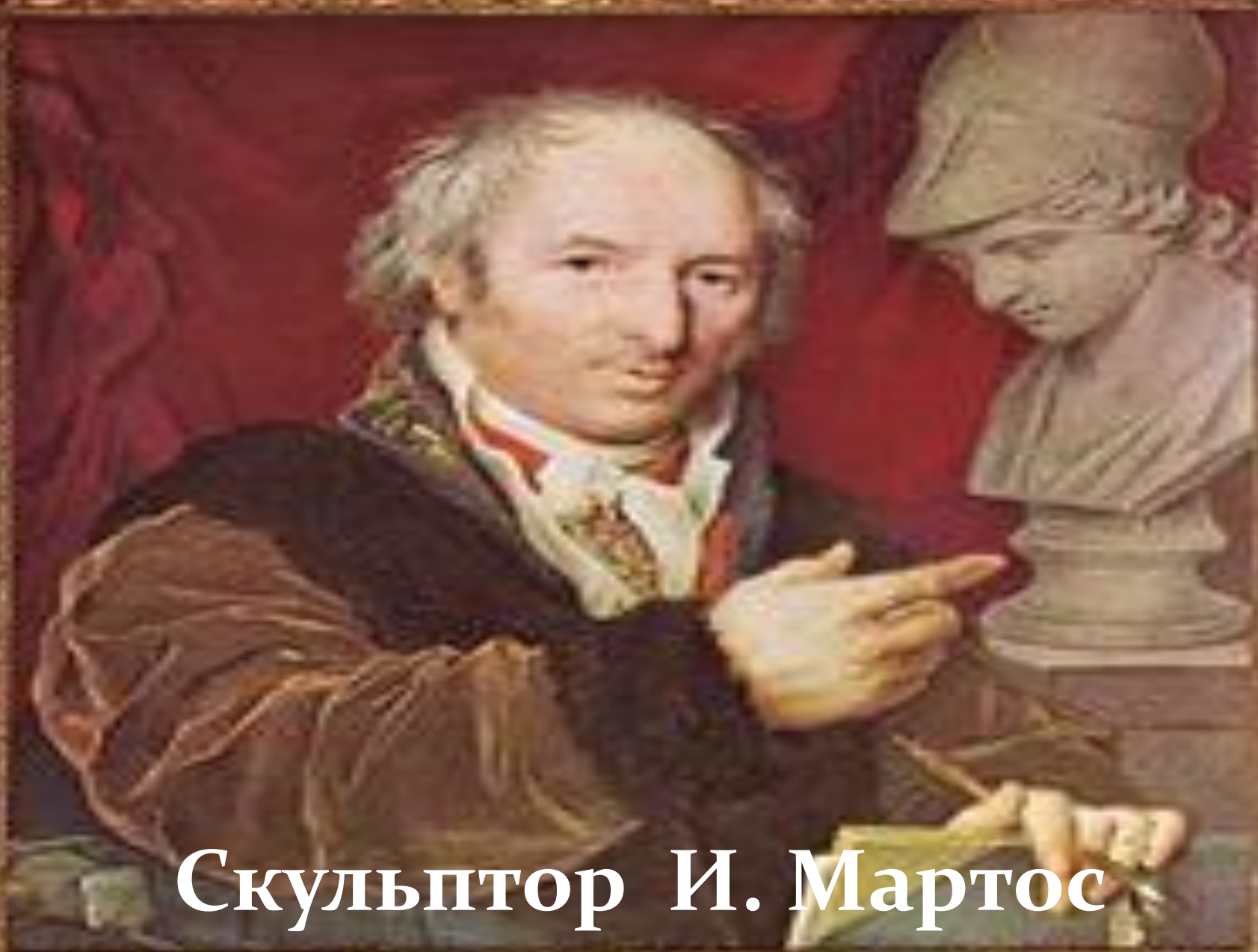
Скульптор И. Мартос