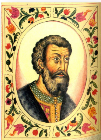
Василий II Тёмный