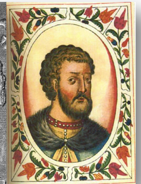
Иван II Красный