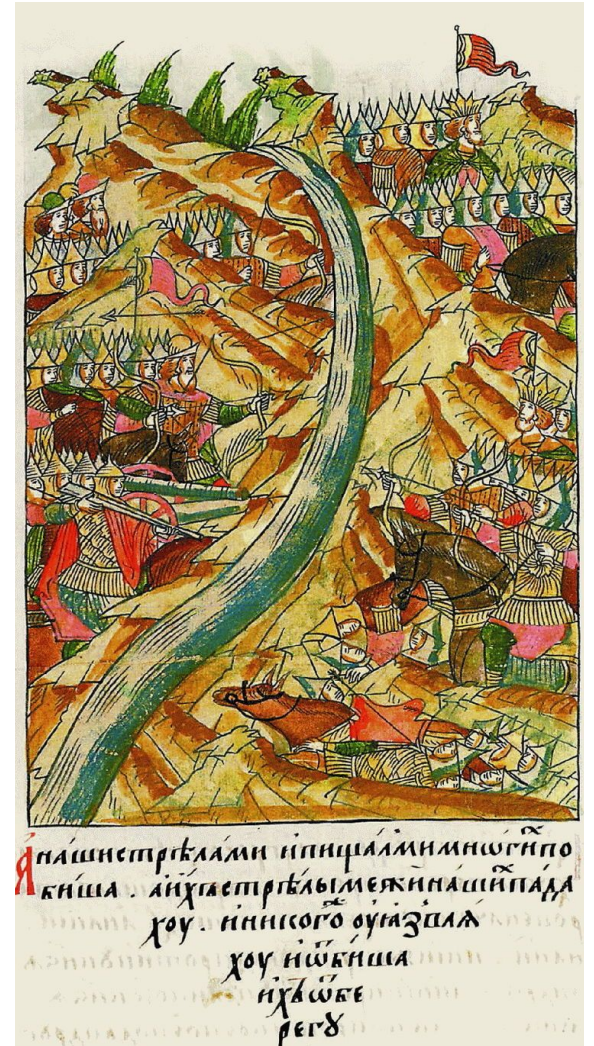
Стояние на Угре. 1480 г. Миниатюра из Лицевого летописного свода. XVI век.