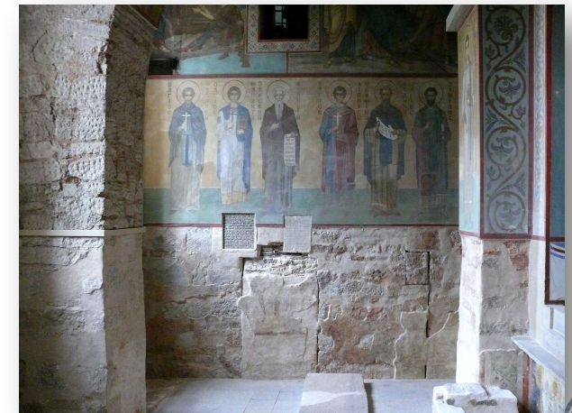
Мартирьева паперть Софийского собора

Первоначальное внутреннее убранство храма сохранилось лишь частично. В Мартирьевской паперти можно увидеть изображение Святых Константина и Елены, датированное XI столетием. В XII веке Софийский собор был расписан полностью. Грандиозные, более трех метров в высоту, фигуры пророков в простенках центрального барабана, изображения святых и орнаментальные мозаики в алтарной части, выразительный полуфигурный деисус в южной галерее - это, к сожалению, почти все, что сохранилось сегодня от былого великолепия.