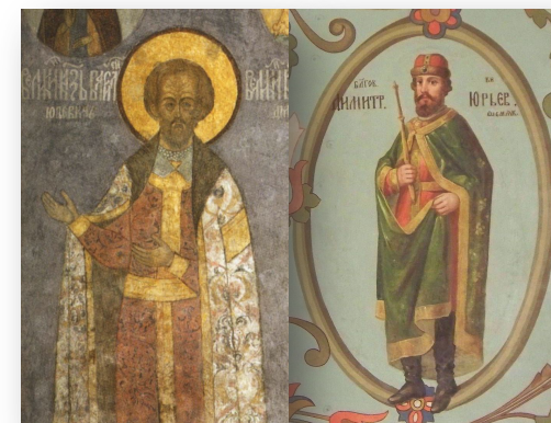
Василий Косой Дмитрий Шемяка