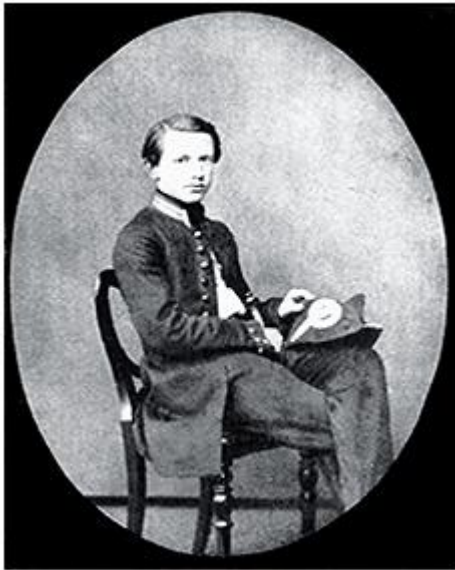
П.И. Чайковский в форме воспитанника Училища правоведения. 1859, Санкт-Петербург

В 1865 году окончил курс консерватории с большой серебряной медалью, написав кантату на оду Шиллера «К радости».