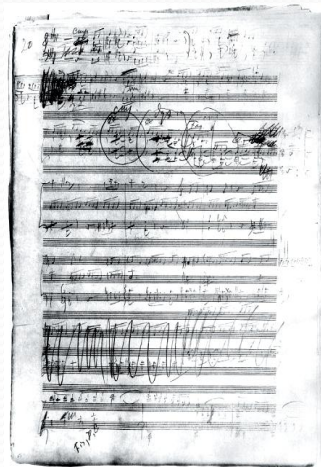
(страница эскизов к Шестой симфонии, 1893 г.)

28 октября, во время погребения Чайковского на кладбище Александровской лавры в Петербурге, впервые было произнесено слово «гениальный».