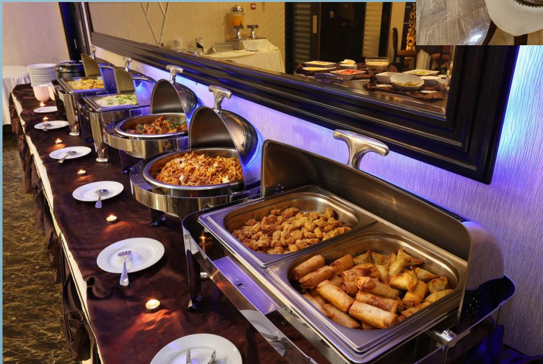
Ресторан Royal Hotel