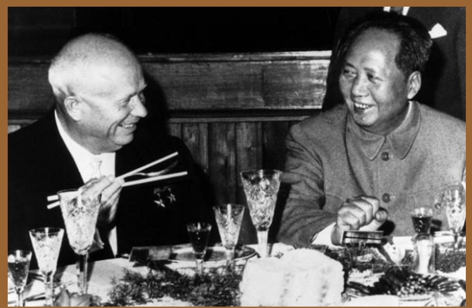
Мао Цзедун и Н.С.Хрущев