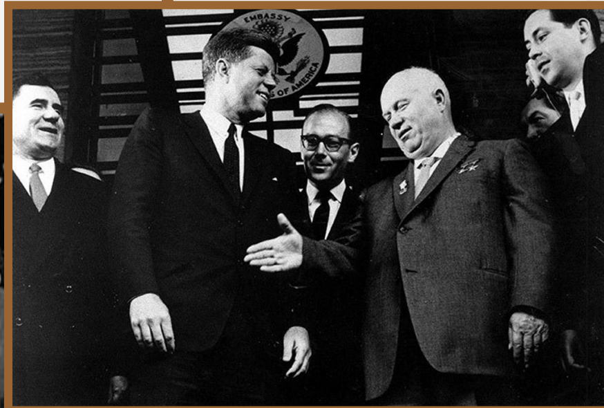
Н.С.Хрущев и Д.Кеннеди