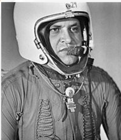
Фрэнсис Гэри Пауэрс

1 мая 1960 года 1960 года Пауэрс выполнял очередной полёт над СССР 1960 года Пауэрс выполнял очередной полёт над СССР. Целью полёта была фотосъёмка военных и промышленных объектов Советского Союза, включая полигон Байконур и центр разработки ядерного оружия Арзамас-16 1960 года Пауэрс выполнял очередной полёт над СССР. Целью полёта была фотосъёмка военных и промышленных объектов Советского Союза, включая полигон Байконур и центр разработки ядерного оружия Арзамас-16, а также запись сигналов советских радиолокационных станций. Пилотируемый Пауэрсом U-2 1960 года Пауэрс выполнял очередной полёт над СССР. Целью полёта была фотосъёмка военных и промышленных объектов Советского Союза, включая полигон Байконур и центр разработки ядерного оружия Арзамас-16, а также запись сигналов советских радиолокационных станций. Пилотируемый Пауэрсом U-2 пересёк государственную границу СССР в двадцати километрах юго-восточнее Кировабада Таджикской ССР 1960 года Пауэрс выполнял очередной полёт над СССР. Целью полёта была фотосъёмка военных и промышленных объектов Советского Союза, включая полигон Байконур и центр разработки ядерного оружия Арзамас-16, а также запись сигналов советских