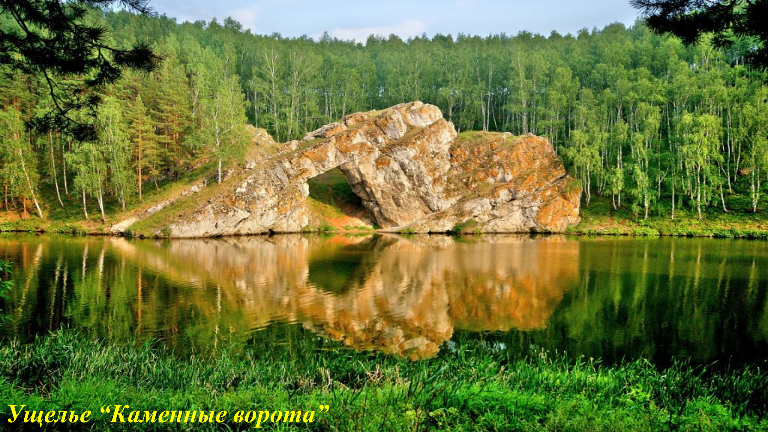
Ущелье “Каменные ворота”