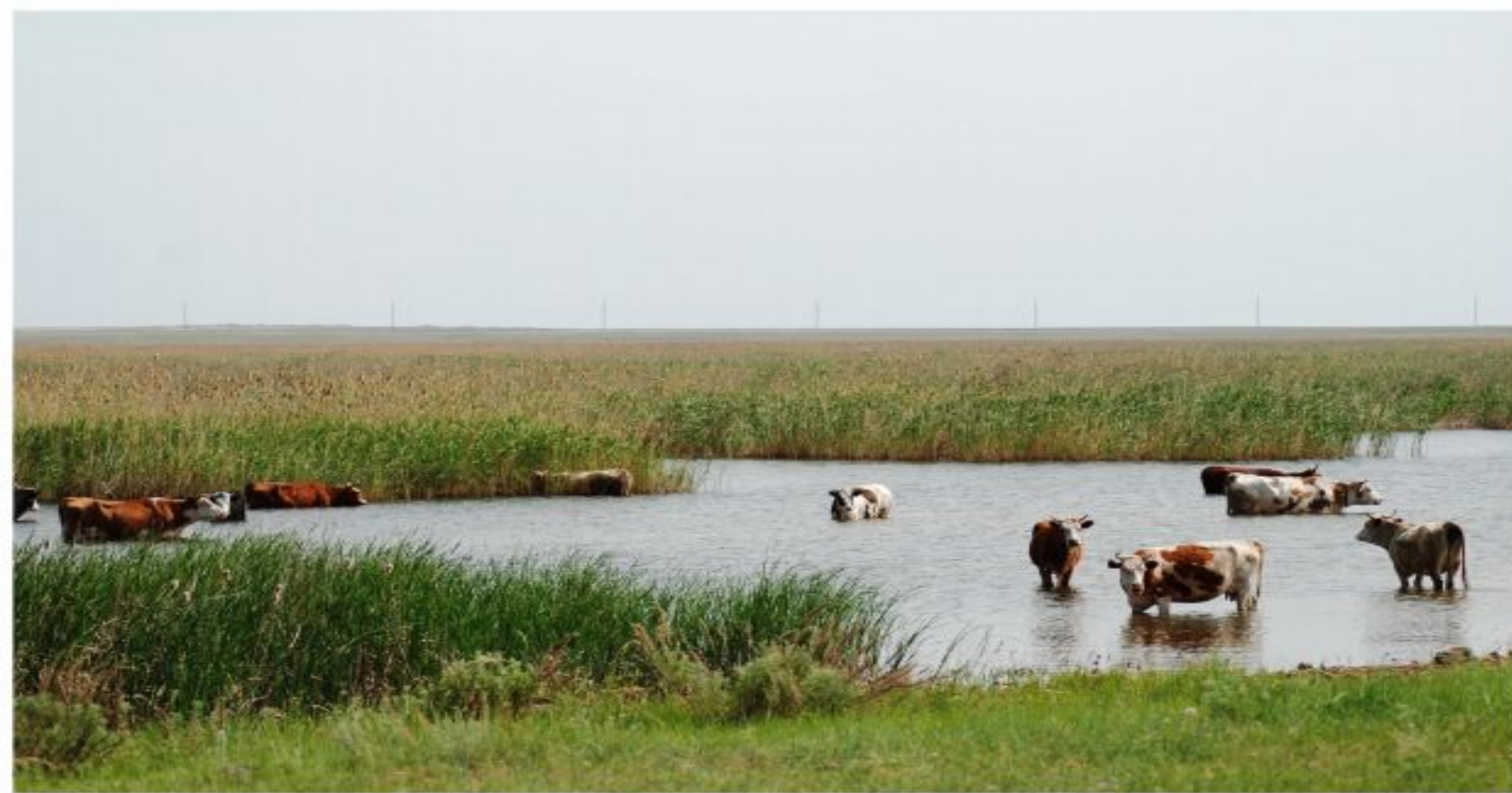
Выпасы и водопой скота в поймах озёр