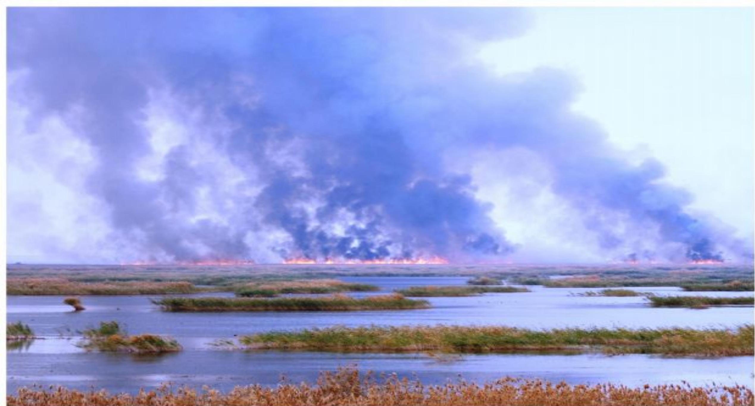
Степной пожар на сопредельной к заказнику территории