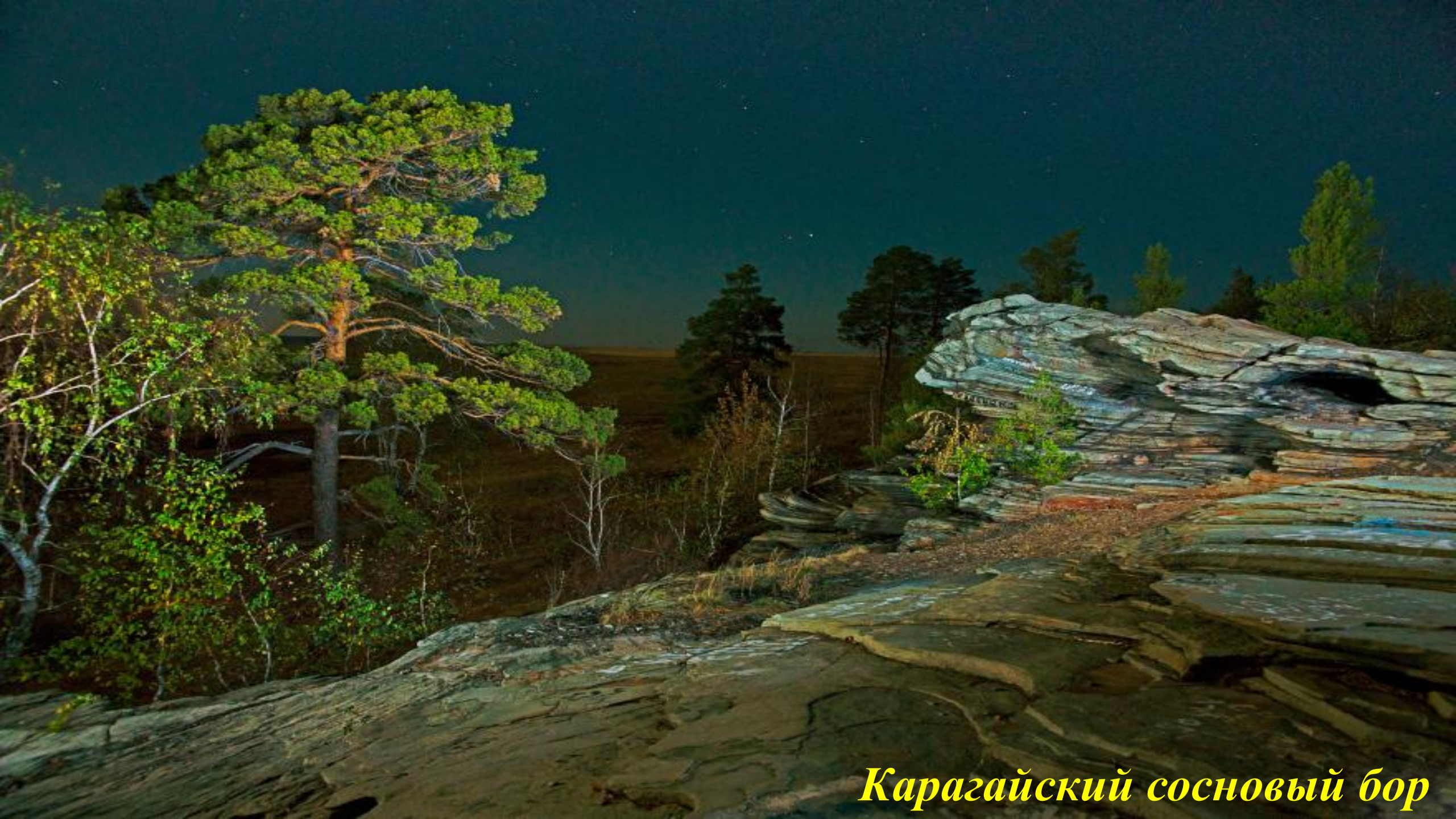
Карагайский сосновый бор