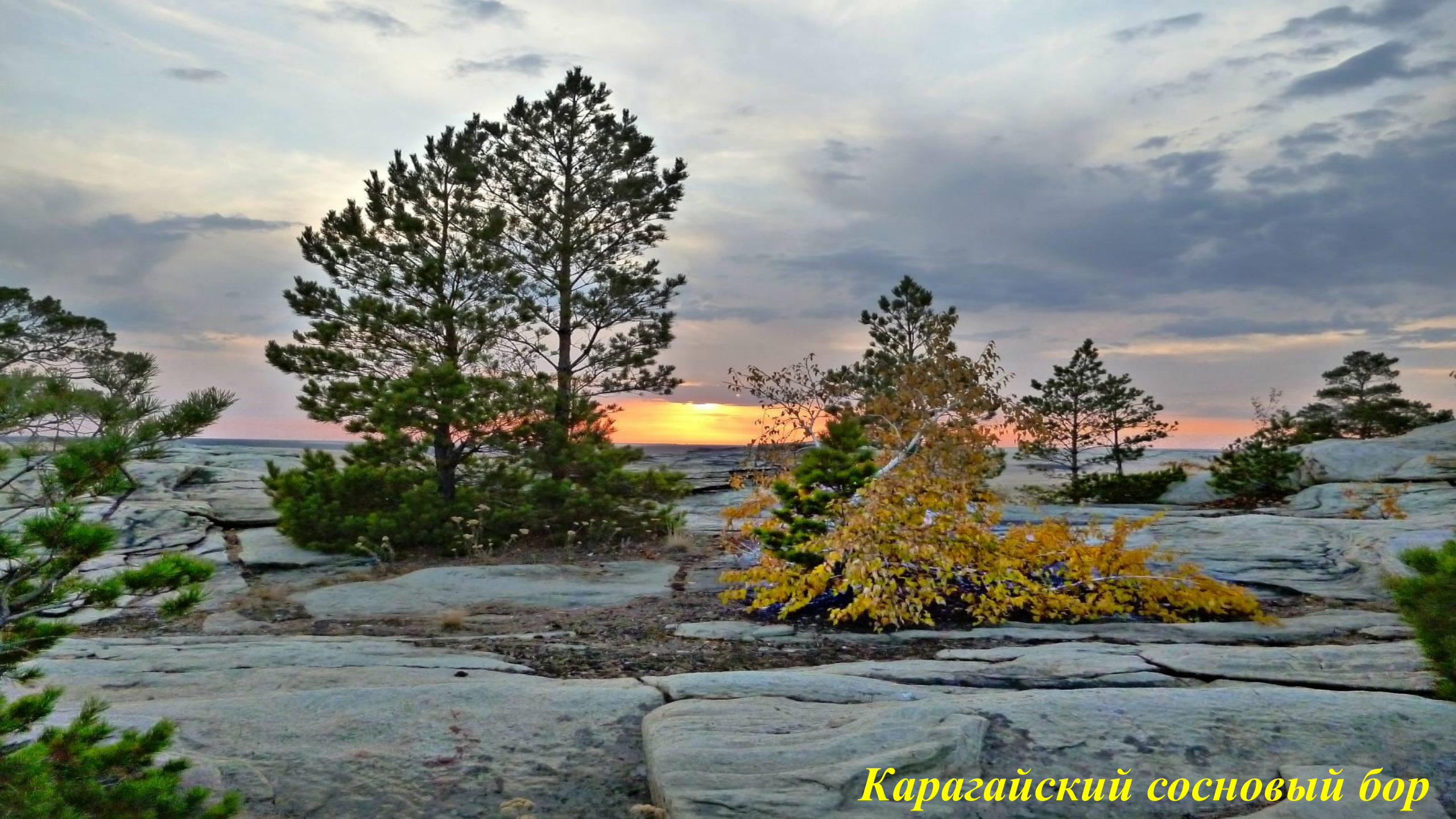
Карагайский сосновый бор