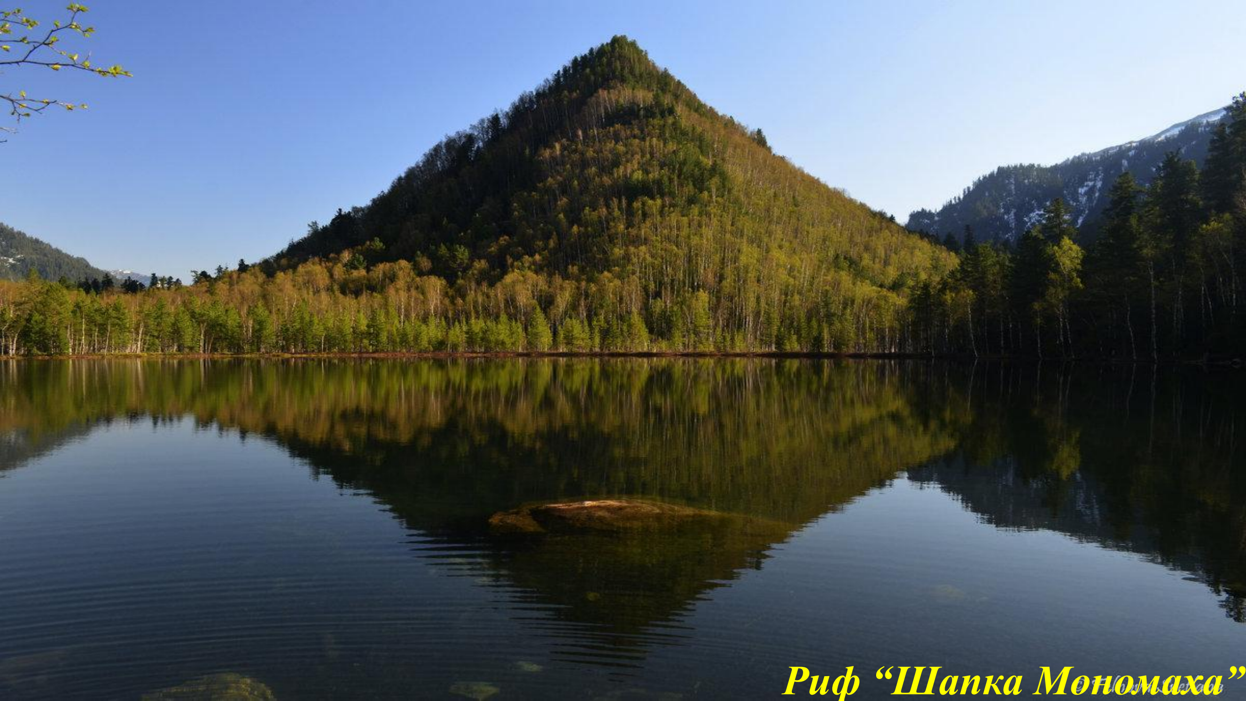
Риф “Шапка Мономаха”