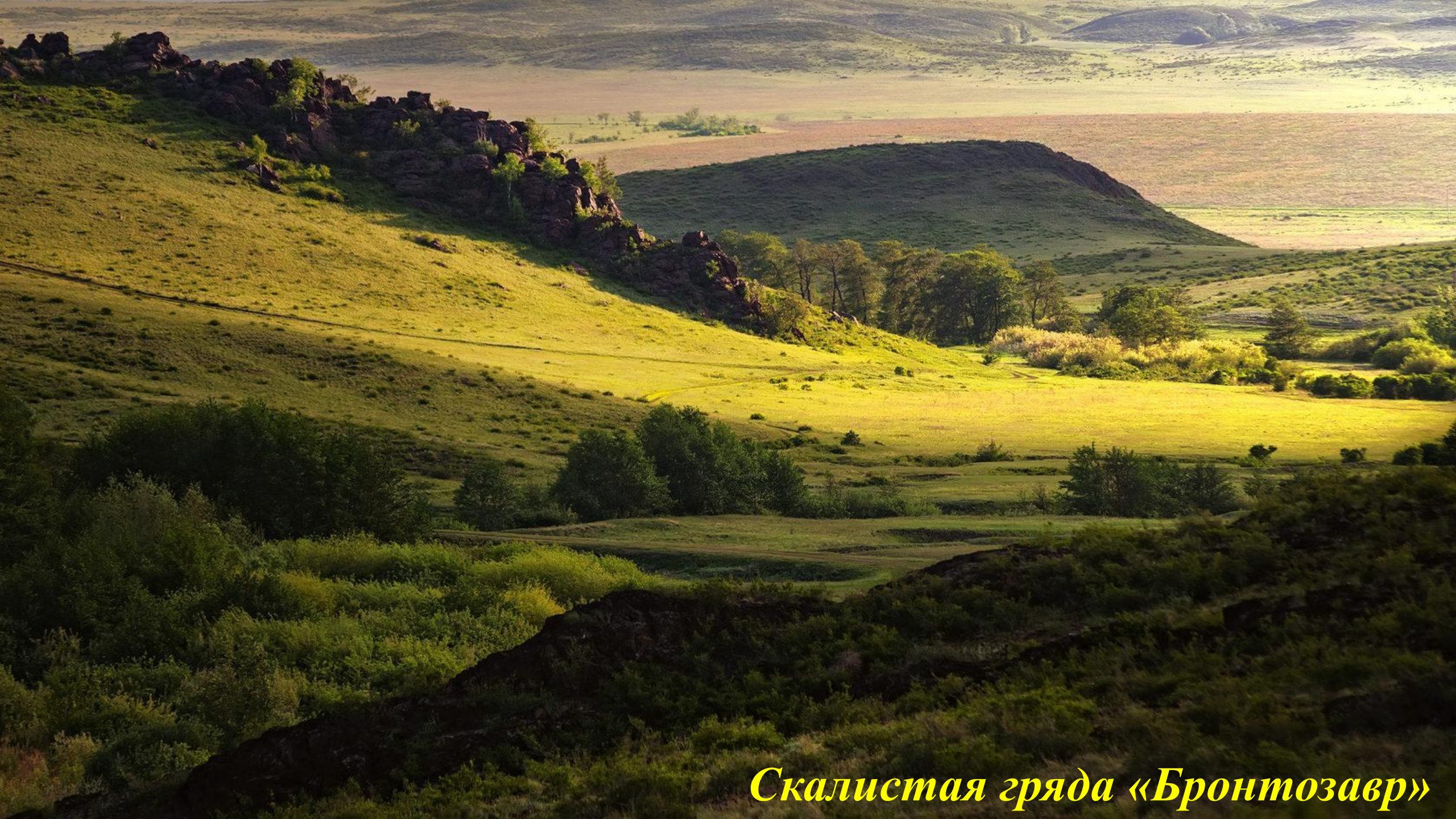
Скалистая гряда «Бронтозавр»