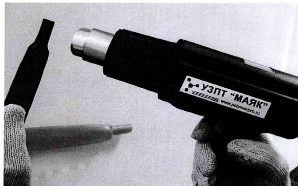
Рисунок 1 – Процесс термоусадки ТУТ

2.4 Усадка ТУТ, обеспечивающая полное обжатие изолируемого изделия, происходит в результате ее нагрева до температуры не менее 120 °С, но не более 200 °С горячим воздухом или открытым пламенем газовой горелки (рисунок 1).