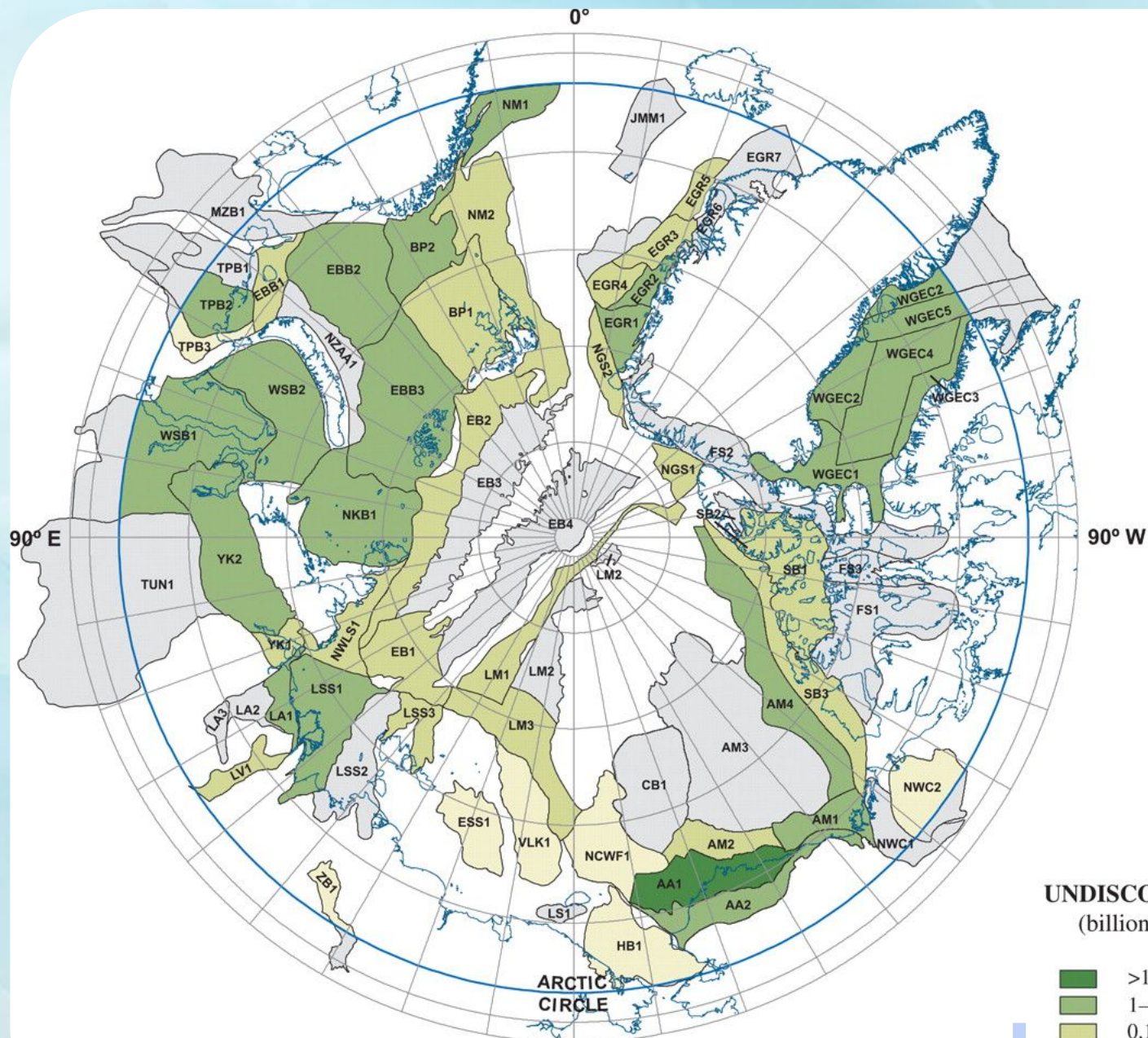
UNDISCOVERED OIL (billion barrels)