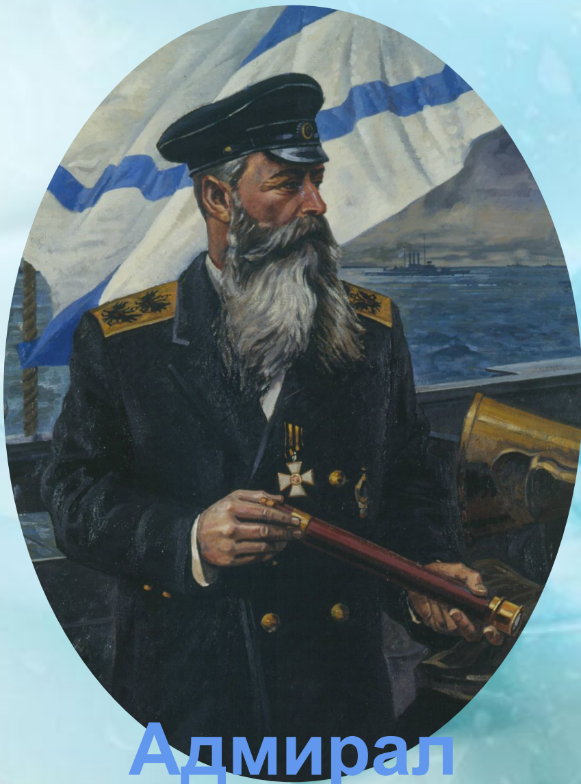
Адмирал С.О. Макаров

«Россия есть здание, фасад которого обращен к Ледовитому океану»