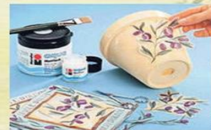
Делать украшения своими руками