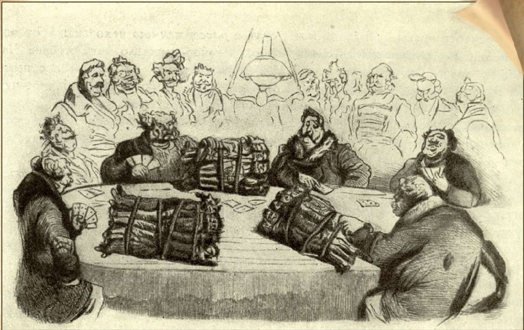
Игра в карты на крепостных. Гравюра по рисунку Г. Дорэ, 30-е гг. XIX в.