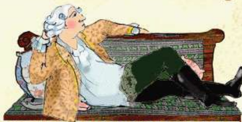
БАРИН ИЛИ ЧИНОВНИК