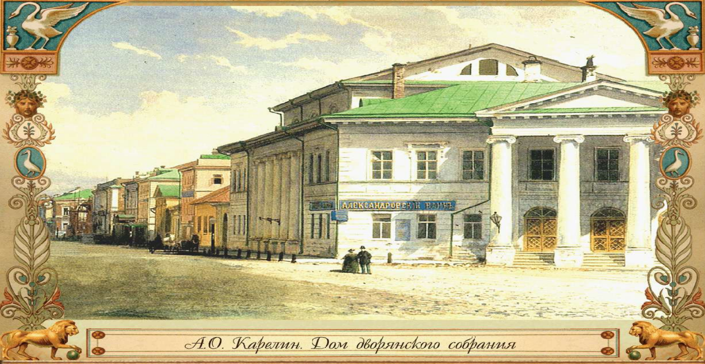
А.О. Карелин. Дом дворянского собрания