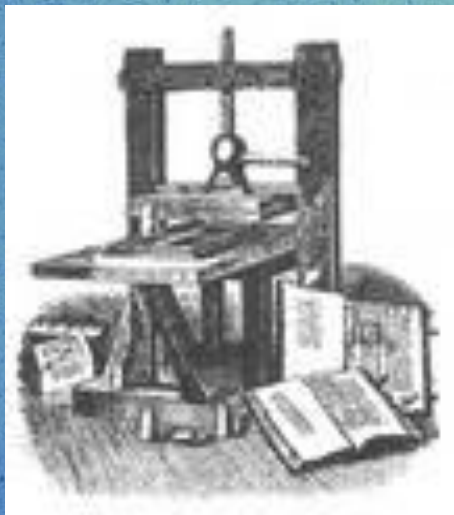
Печатный станок Гутенберга

На протяжении последующих столетий в газетах мало что изменилось: вплоть до изобретения в Германии в 1450-х гг. Иоганном Гутенбергом печатного пресса, позволявшего размножать текст и изображения, не прибегая к услугам переписчиков, газеты (представлявшие собой всё те же переписанные от руки свитки с главными новостями) оставались весьма дорогим атрибутом жизни высокопоставленных чиновников или богатых торговцев.