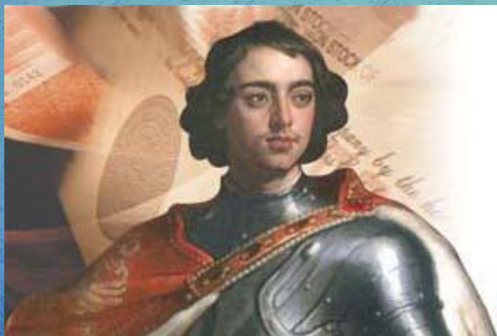
□ Петр I