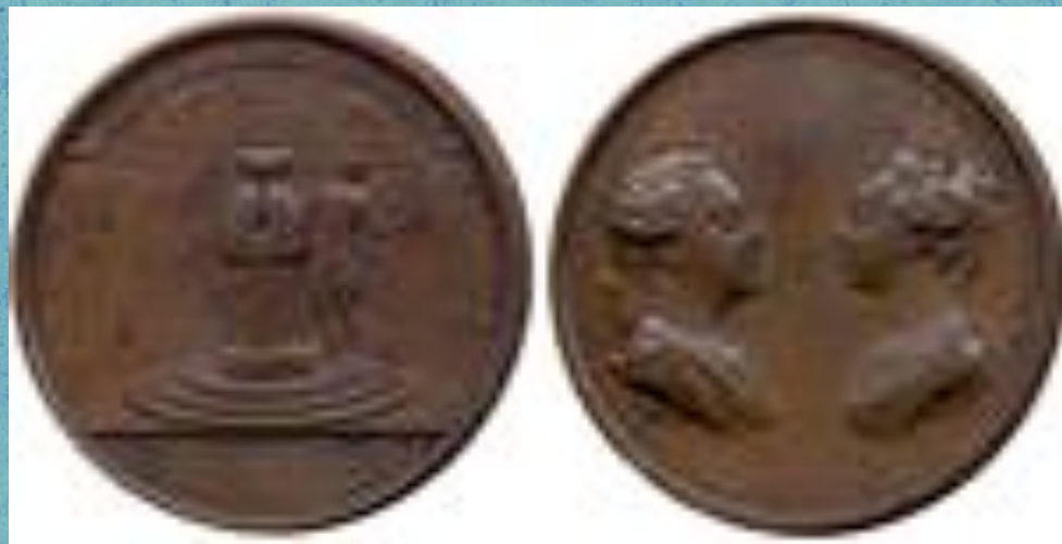
Итальянская монета gazzetta

Свой современный облик газеты начали приобретать в XVI веке. Тогда и вошло в обиход само название «газета» — по наименованию мелкой итальянской монеты gazzetta , которую обычно платили за рукописный листок новостей в Венеции. Считается, что именно в этом городе были образованы первые бюро по сбору информации — прообразы информационных агентств — и возникла профессия «писателей новостей».