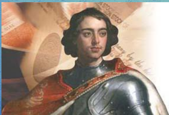
□ Петр I