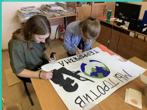
Мы против терроризма