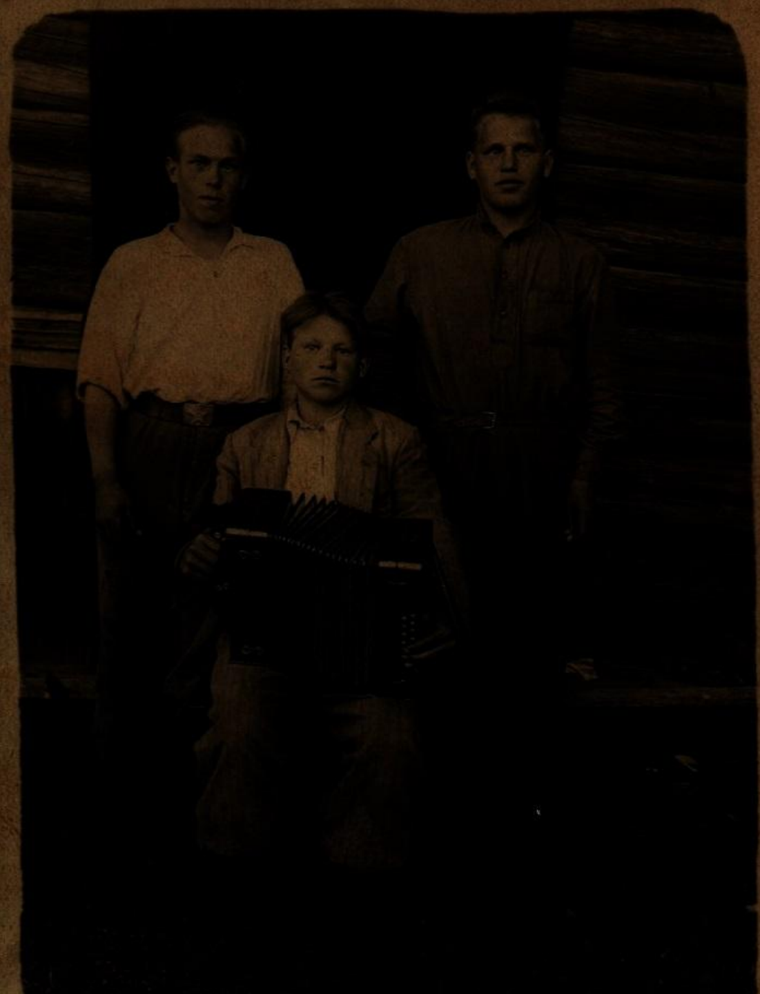
Фото 1955 г.