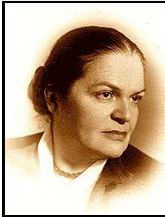
Бронислава Давыдовна Корсунская