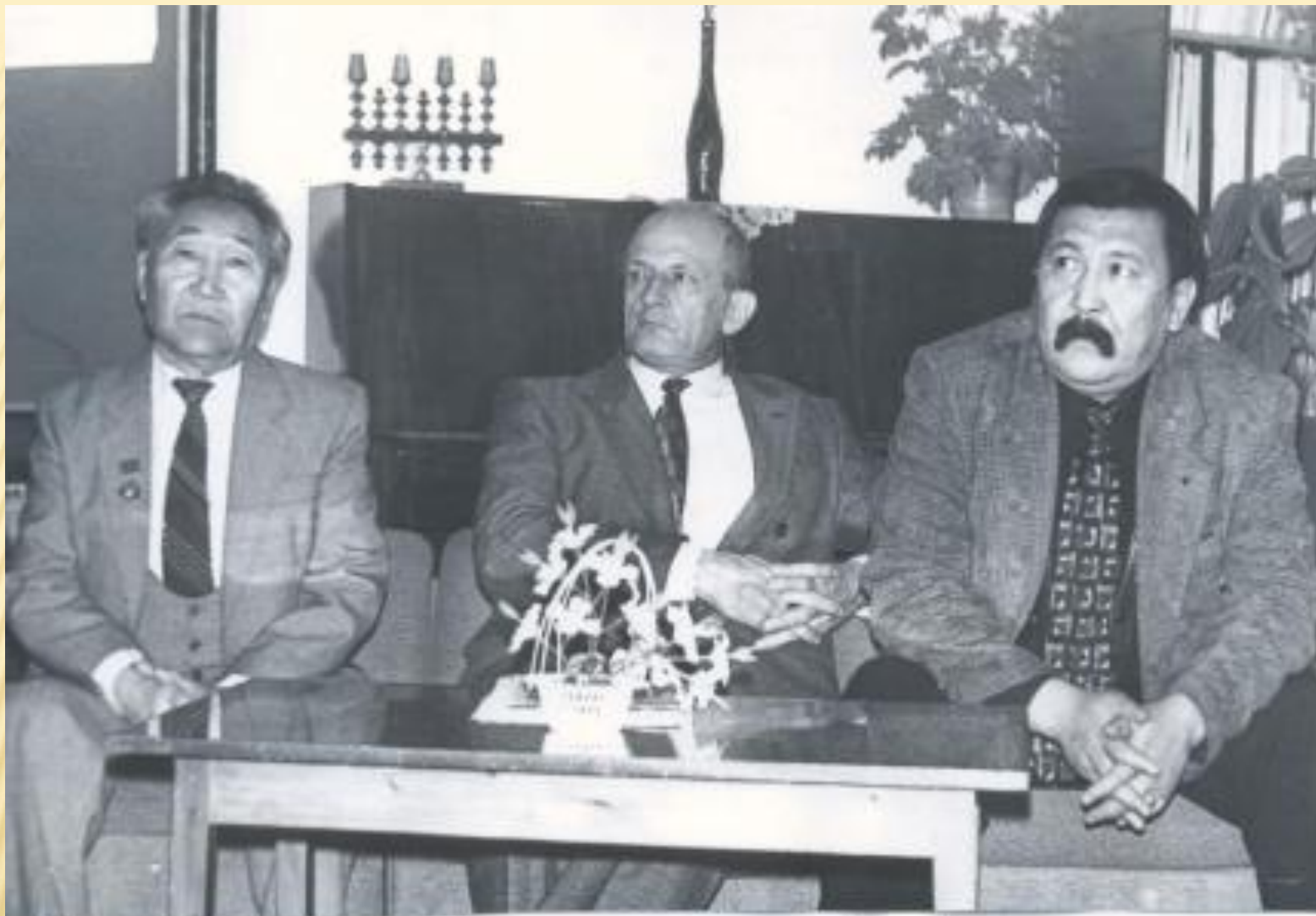
Творческая встреча с писателями в Целинном районе