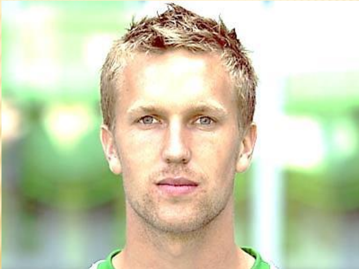
европеоиды (евразийская раса)

НАИБОЛЕЕ РАСПРОСТРАНЕННА КЛАССИФИКАЦИЯ, В КОТОРОЙ ВЫДЕЛЯЮТСЯ ЧЕТЫРЕ БОЛЬШИЕ РАСЫ