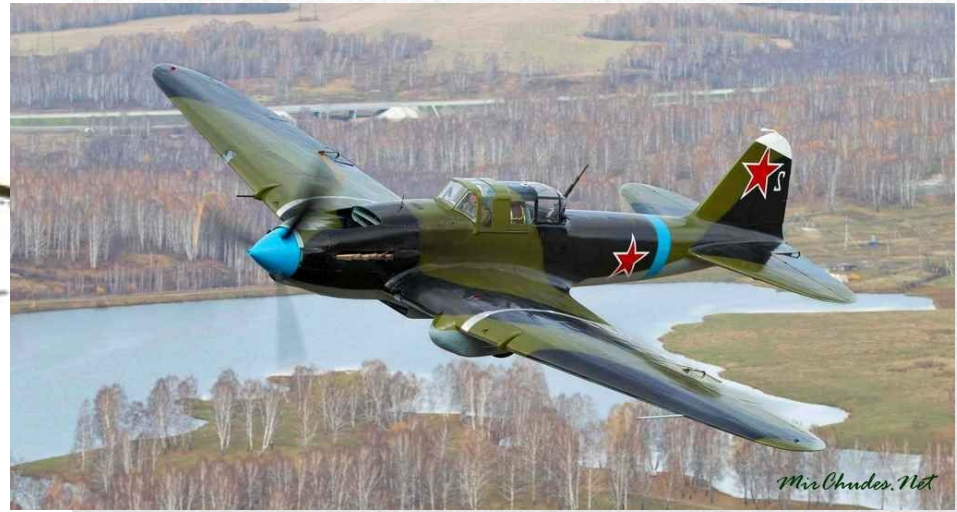
ИЛ – 2

Советский штурмовик ИЛ – 2 по многим параметрам превосходил немецкий Юнкерс Ju 87 «Штука», и стал самым массовым самолетом не только за начальный, но и за весь период ВОВ. «Летающий танк» – так его прозвали.