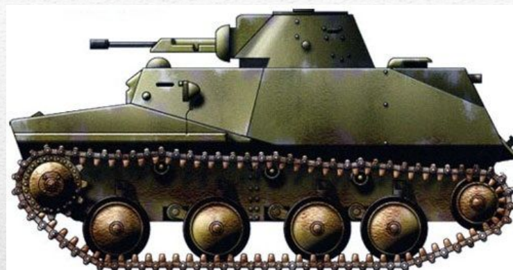
T-40 производства 1940 года