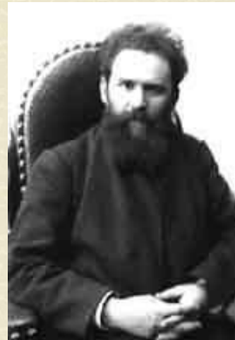
Короленко Владимир Галактионович 1853-1921