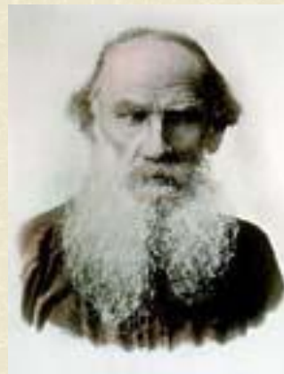
Толстой Лев Николаевич 1828-1910