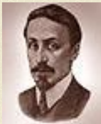
Вересаев Викентий Викентьевич 1867-1945