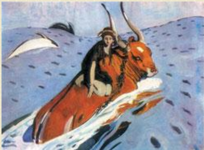
В.Серов «Похищение Европы»