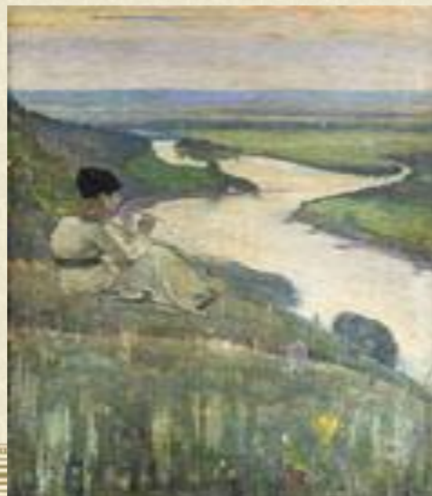
М.Нестеров «На земле покой»