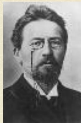
Чехов Антон Павлович 1860-1904