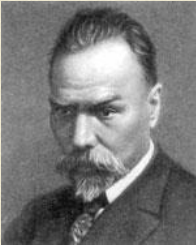
Брюсов В. Я.