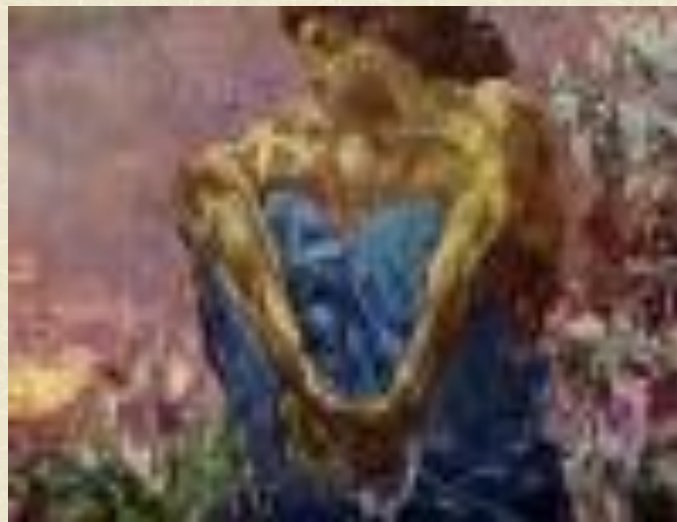
М.Врубель «Сидящий Демон»