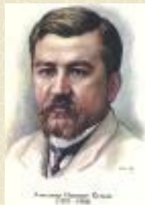
Куприн Александр Иванович 1870-1938