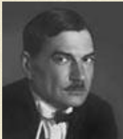
Андреев Леонид Николаевич 1871-1919