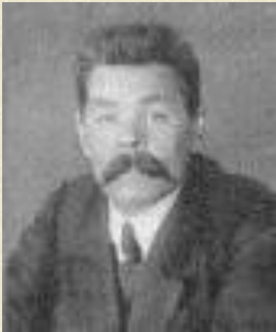
Максим Горький 1868-1936