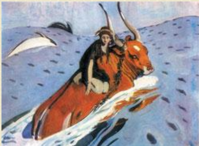
В. Серов «Похищение Европы»