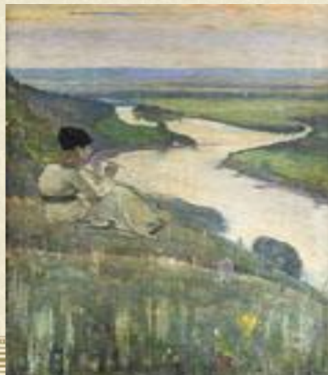
М. Нестеров «На земле покой»