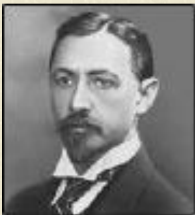
Бунин Иван Алексеевич 1870-1953