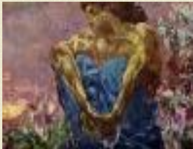
М. Врубель «Сидящий Демон»