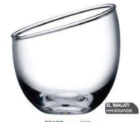
22168 h: 270 mm KASE Ø: 110 mm 2 1/4 - 3 1/2"