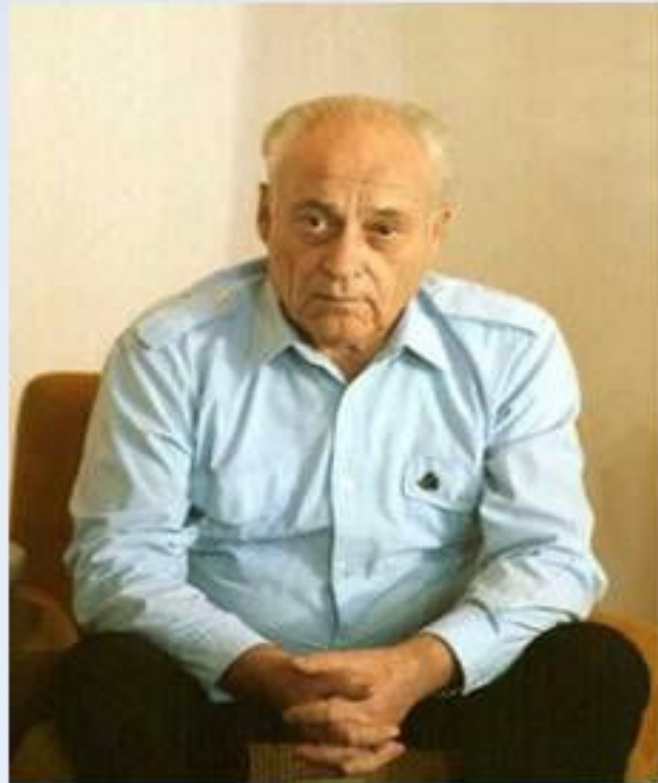
Рыбаков(Аронов) Анатолий Наумович (14.01.1911-23.12.1998)