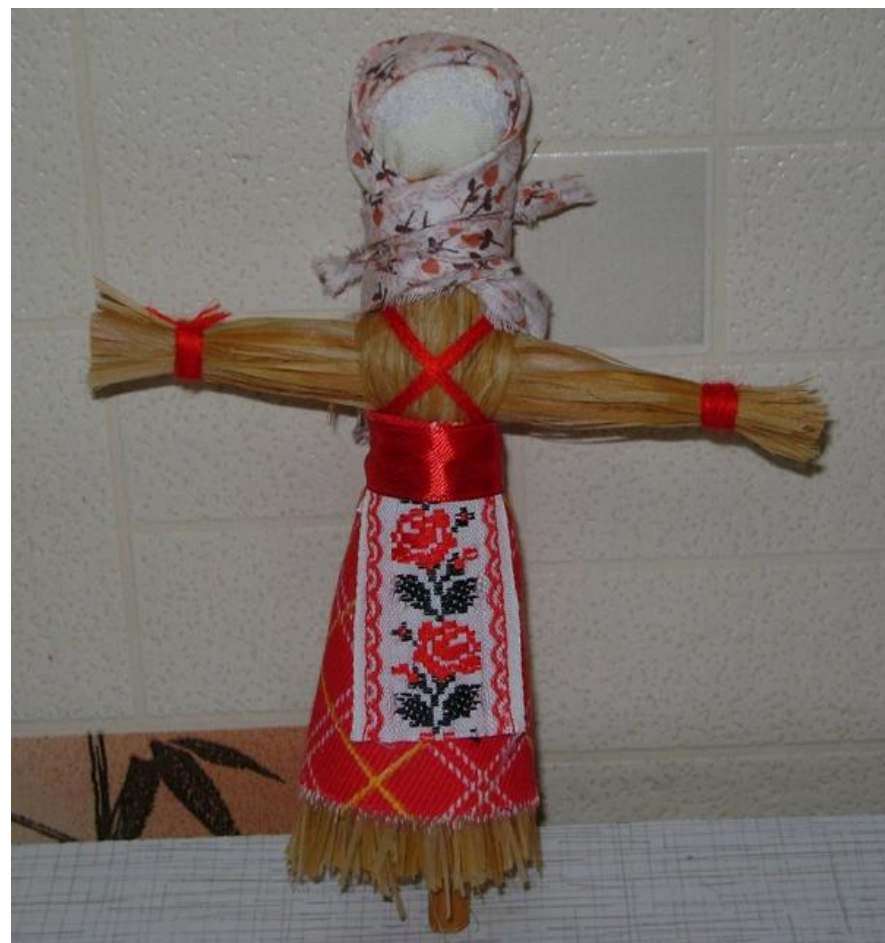
Крестушка. Кукла на палочке.