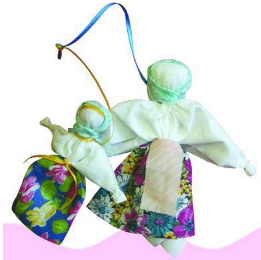
Закрутка (скрутка, скатка, скалка).