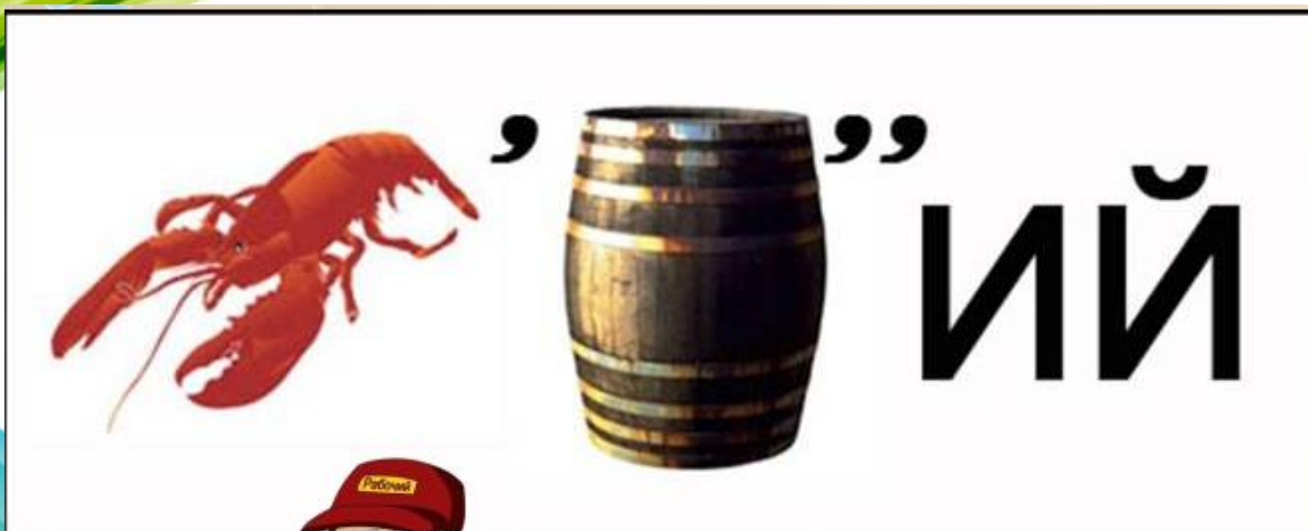
Рисунок 2 – рабочий