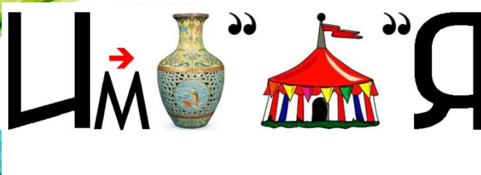
Рисунок 3 – Мотивация