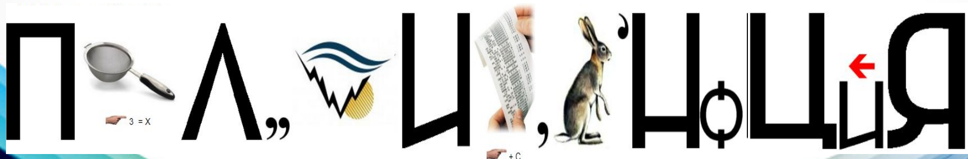
Рисунок 5 -психологическая функция