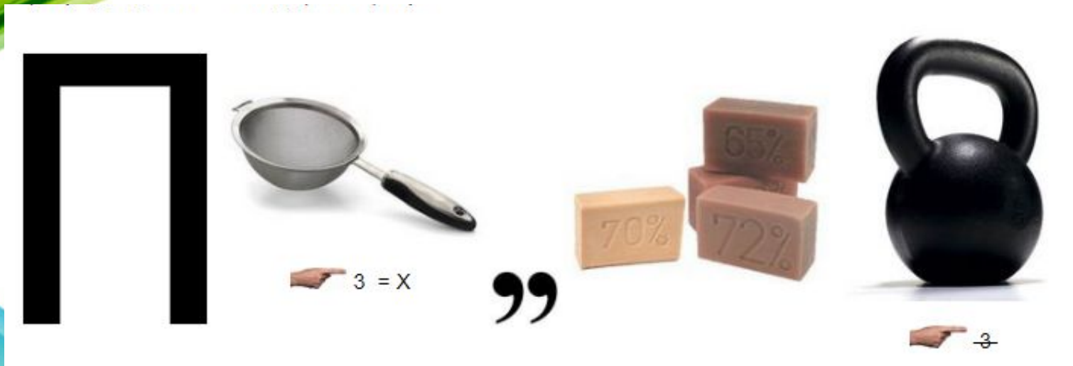
Рисунок 4 – психология