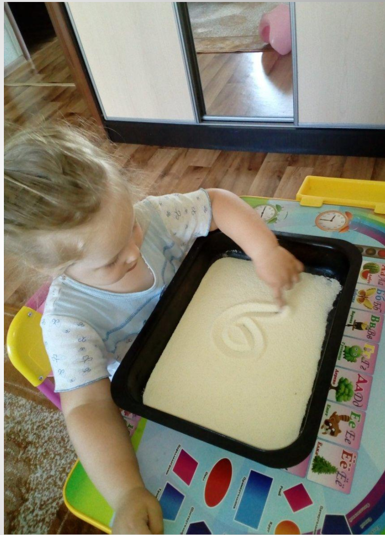
Рисуем пальчиком и щепотью