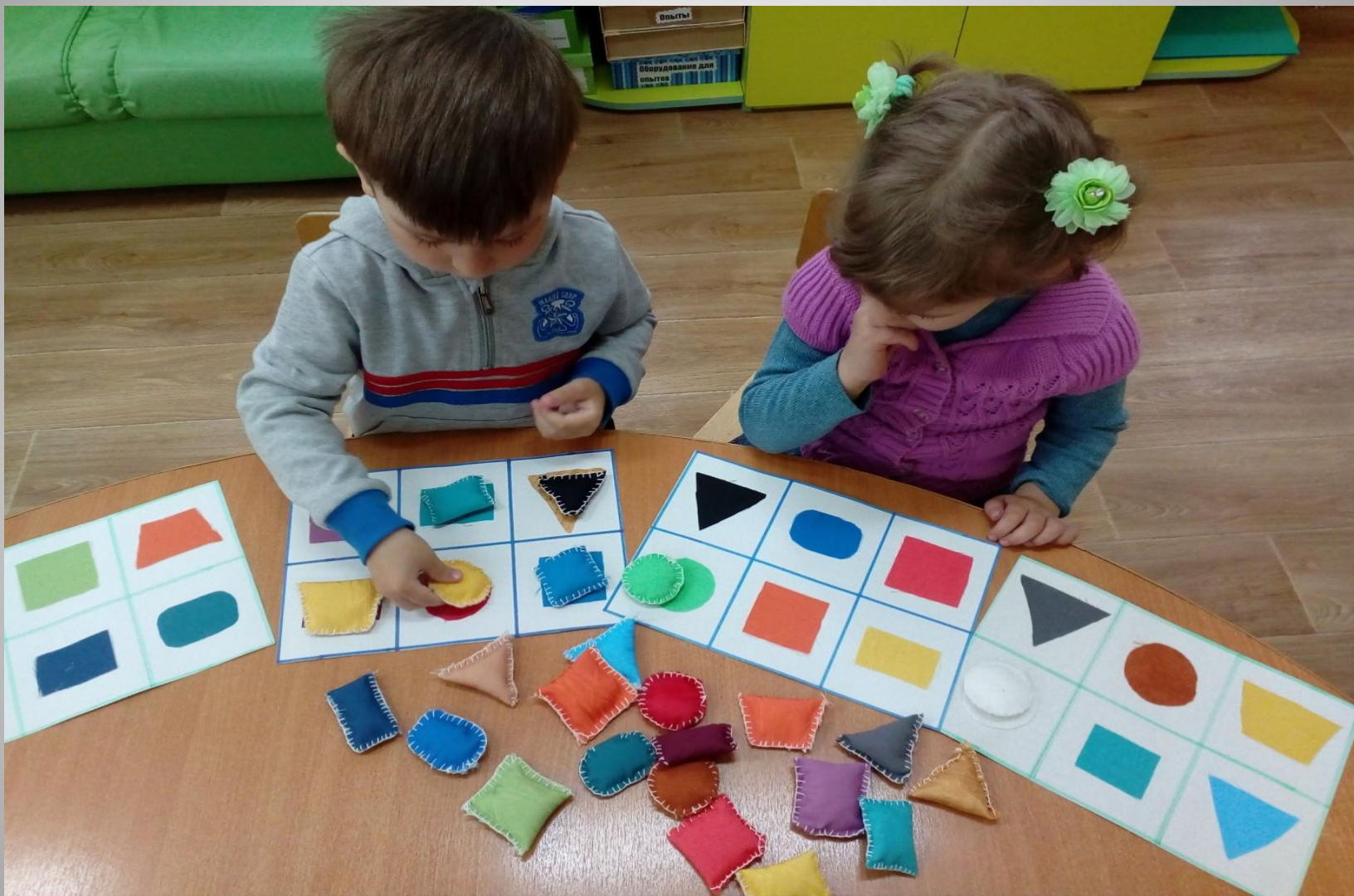
Мягкие геометрические фигуры