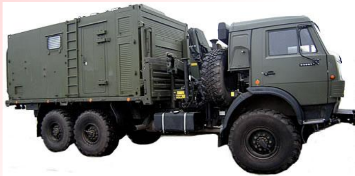
Размещение рабочих мест (постов) в машине МТО-УБ-2