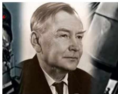
Михаил Клавдиевич Тихонравов