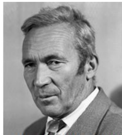
Андрей Николаевич Колмогоров