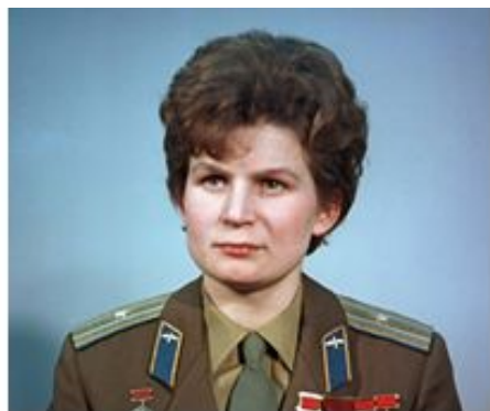
Валентина Владимировна Терешкова