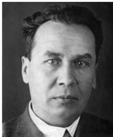
Михаил Ильич Кошкин