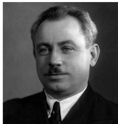
Иван Дмитриевич Папанин