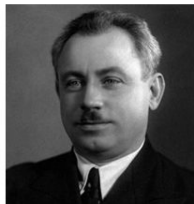
Иван Дмитриевич Папанин