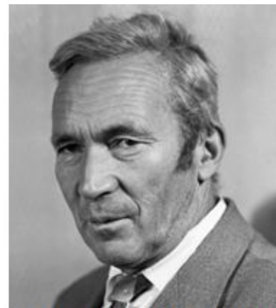
Андрей Николаевич Колмогоров