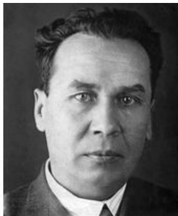
Михаил Ильич Кошкин