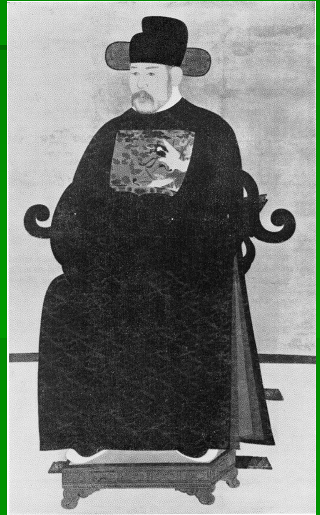
Портрет Чо Мальсэна. 15 в.