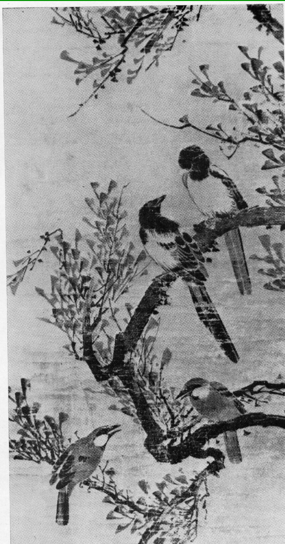
Чо Сок. Птицы на дереве. 17 в.