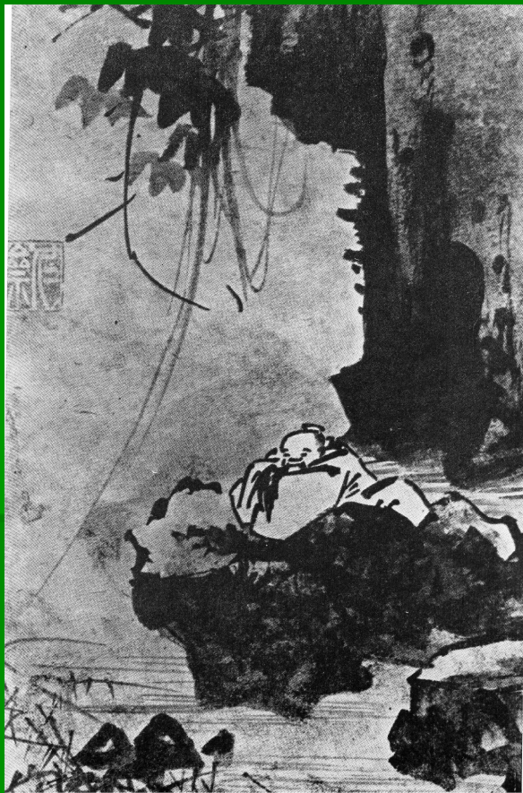
Кан Хян. Лежащий в раздумьях под деревом. 15 в.