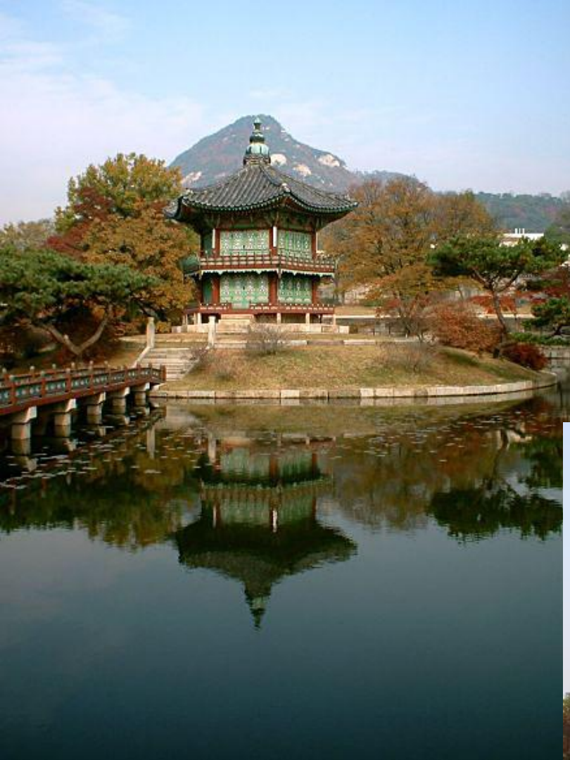
Павильон Кёнверху. 1412 г. Лotosовый пруд