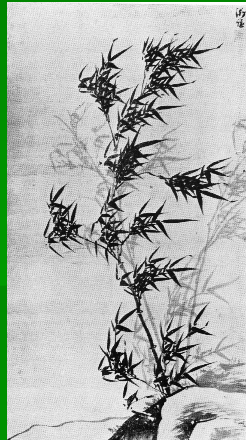
Ли Джон. Бамбук. 16 в.