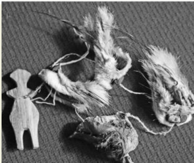
Охотничий амулет эвенков