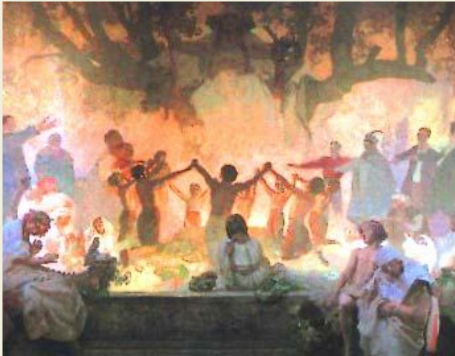
Древнеславянский праздник Мать- Сыра-Земля-Именинница