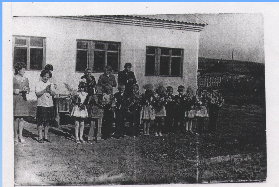
Первая средняя школа