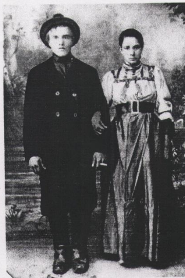
Гагин Степан Савельевич 1805 г.р.