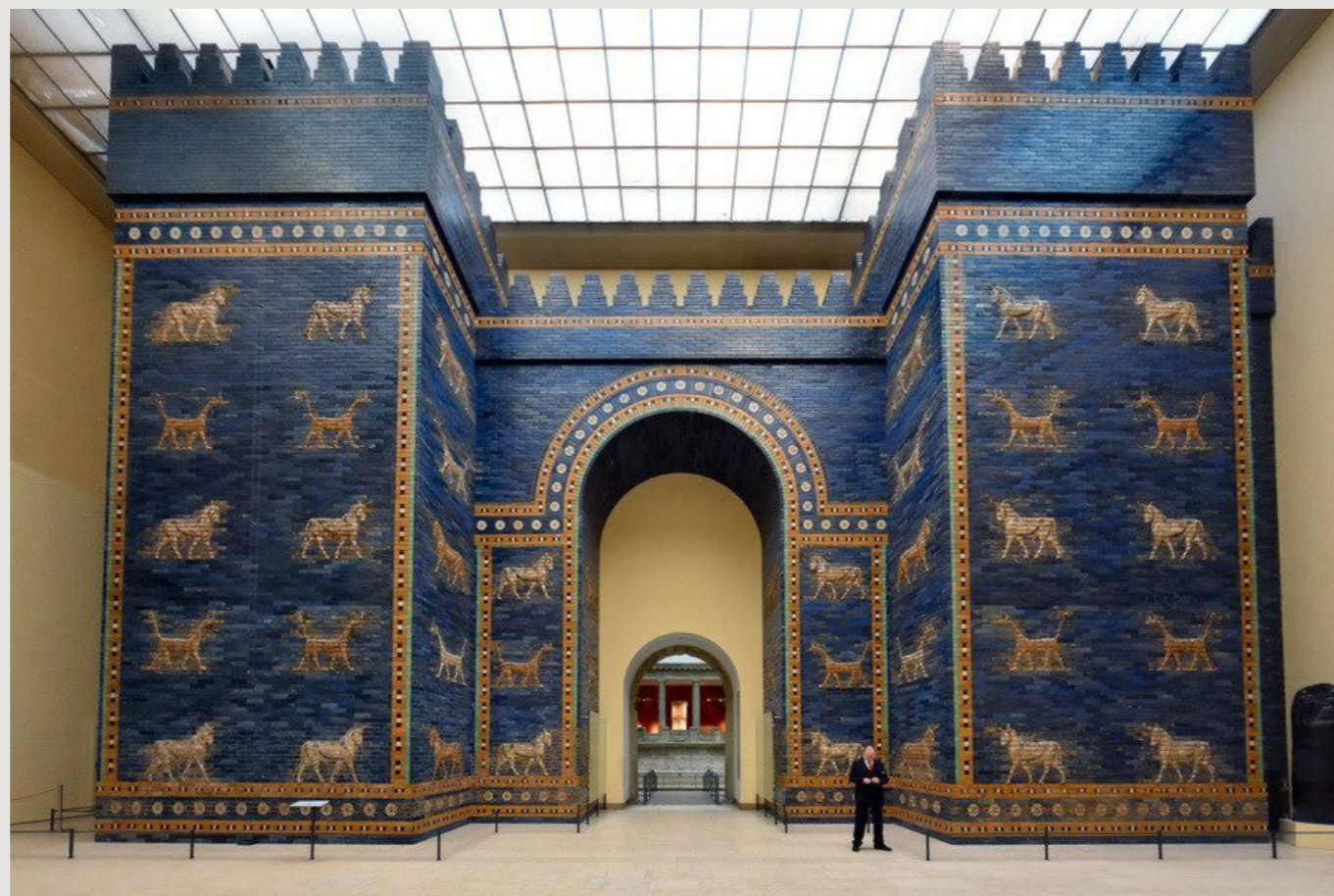
ворота богини Иштар