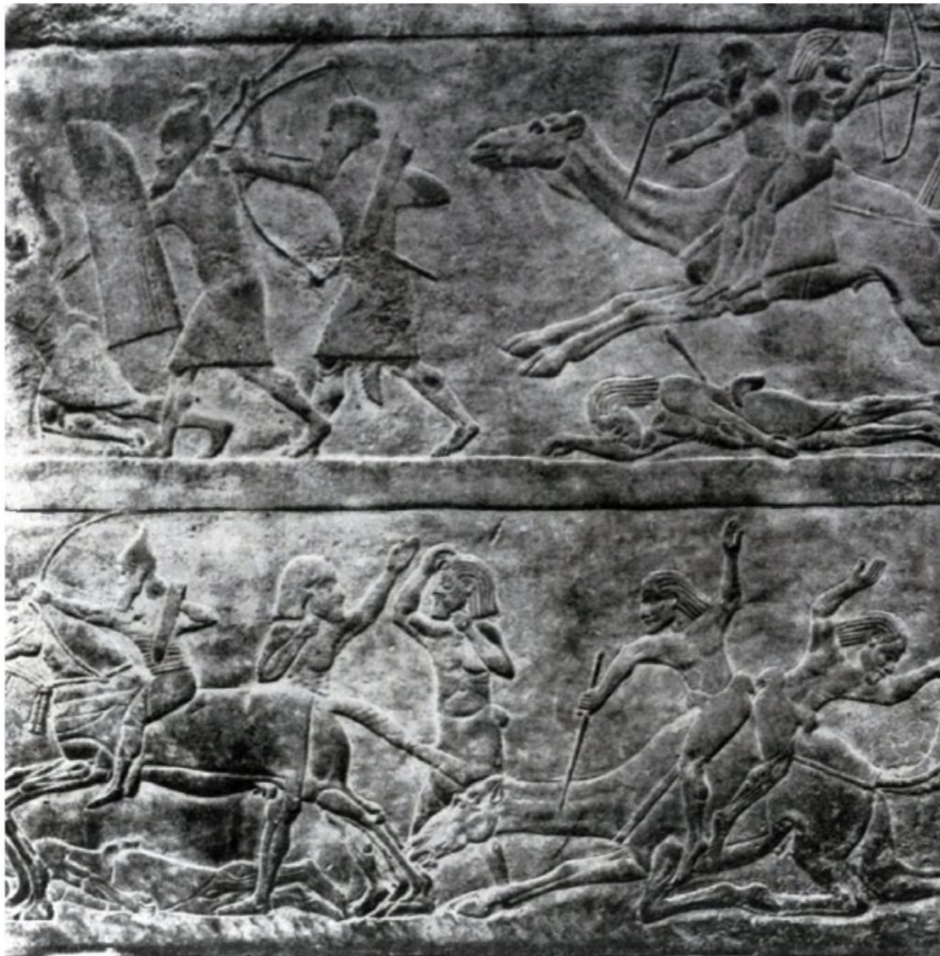
30. Битва на верблюдах. Рельеф из дворца Ашшурбанипала в Ниневии. Алебастр. Середина 7 в. до н. э. Лондон. Британский музей.

Сюжетами композиций были война, охота, сцены быта и придворной жизни, сцены религиозного содержания . Главное внимание сосредоточивалось на тех изображениях, где царь являлся центральной фигурой .