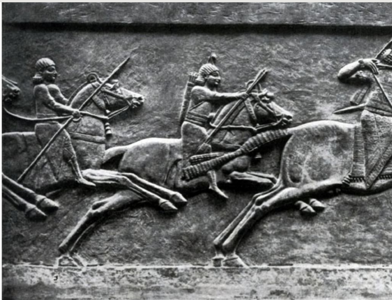
31. Охота Ашшурбанипала. Рельеф из дворца Ашшурбанипала в Ниневии. Алебастр. Середина 7 в. до н. э. Лондон. Британский музей.

Модели у мастеров этого времени кажутся как бы приведенными к единому типу.