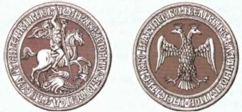
Печать Ивана III. Конец XV в.