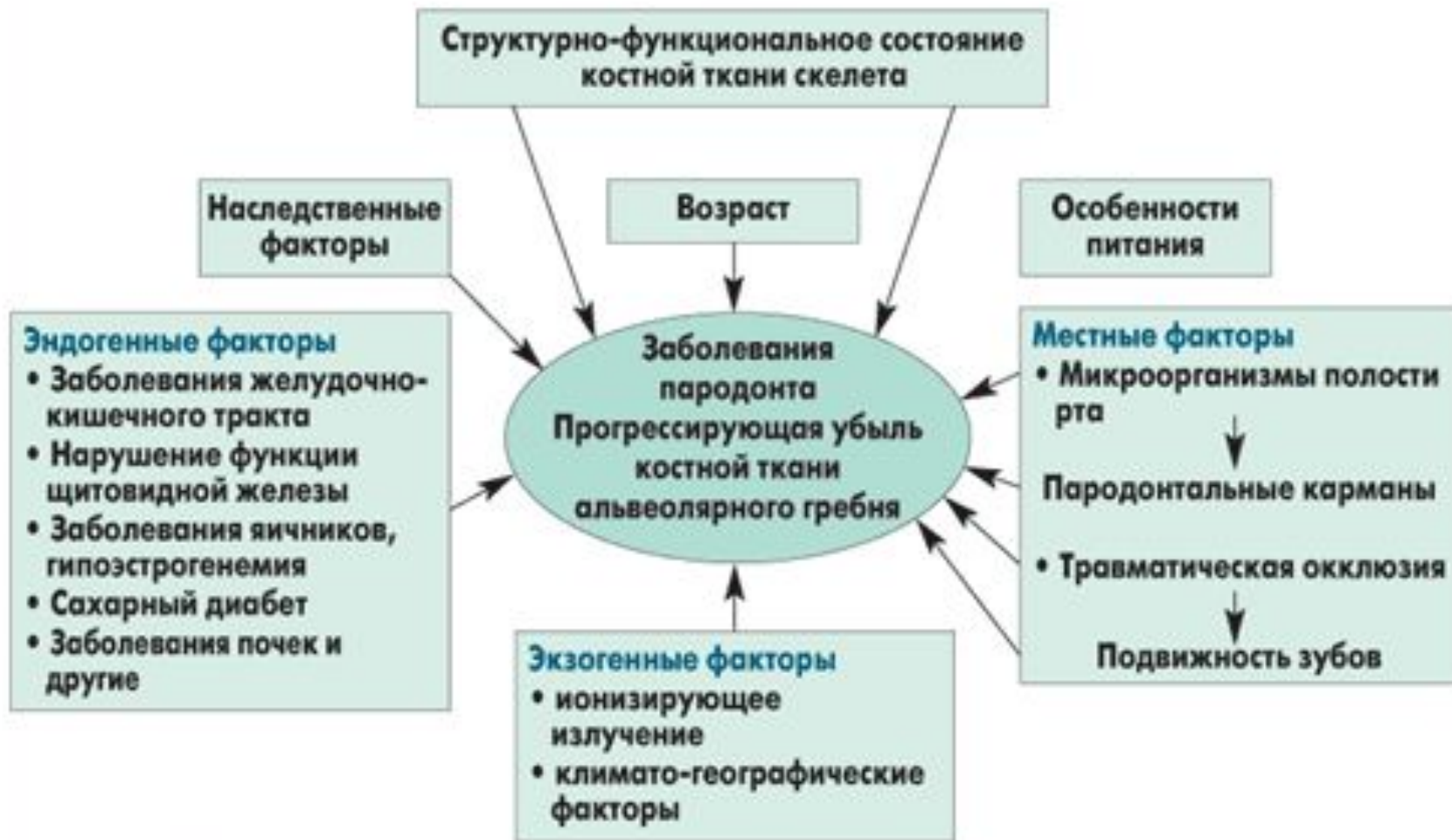
Рис. Факторы, обуславливающие прогрессирование убыли альвеолярного гребня

Пародонт ауруының әсерінен ауыз қуысындағы байқалған жағдайлар