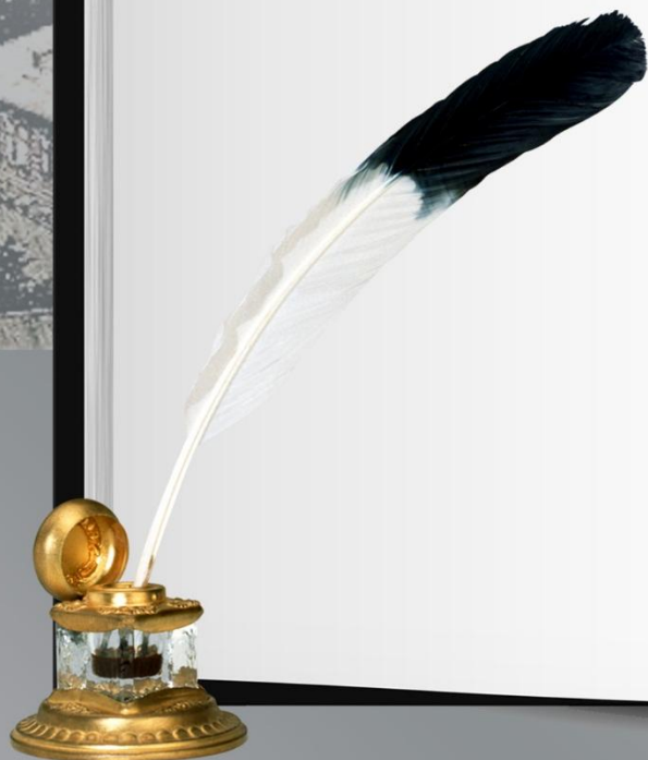
Схема сочинения- рассуждения