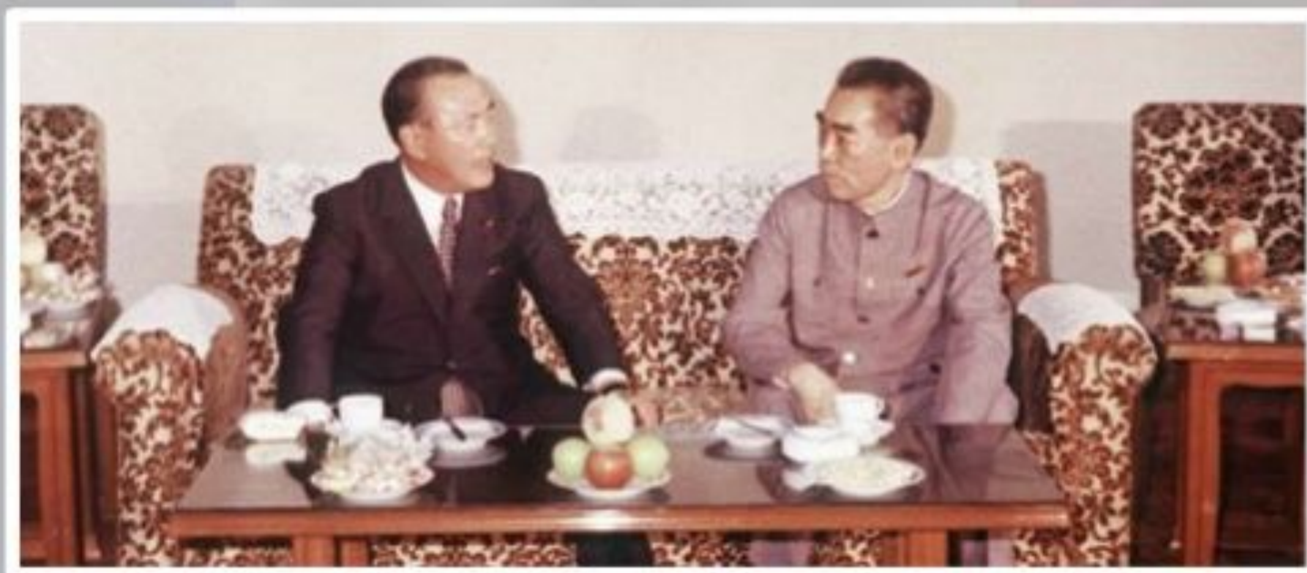
Встреча премьер-министра Японии Какуэй Танаки и премьера Госсовета КНР Чжоу Эньлая. Пекин. 1972 г.

Во внешней политике Япония направила все свои усилия на налаживание дипломатических отношений со своими соседями. В 1965 – 1970-е гг. японское правительство установило тесные контакты со странами Азии. В 1972 г. японский премьер-министр посетил Китай, после чего Япония прекратила дипломатические отношения с Тайванем.