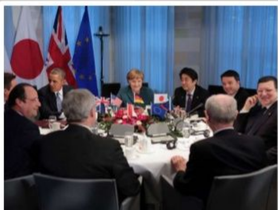
«Большая семёрка» в Брюсселе. 2014 г.

С ноября 1975 г. Япония стала непременным участником всех ежегодных встреч глав наиболее развитых капиталистических стран (стран «большой семёрки»). Основной доктриной современной внешней политики остаётся концепция союза с США, сохраняющими военные базы в Японии. В 1987 г. было заключено соглашение об участии Японии в программе «звёздных войн». Осенью 1997 г. военные министры и министры иностранных дел США и Японии подписали в Вашингтоне новое соглашение об основных направлениях военного сотрудничества двух стран на основе японо-американского договора о безопасности.