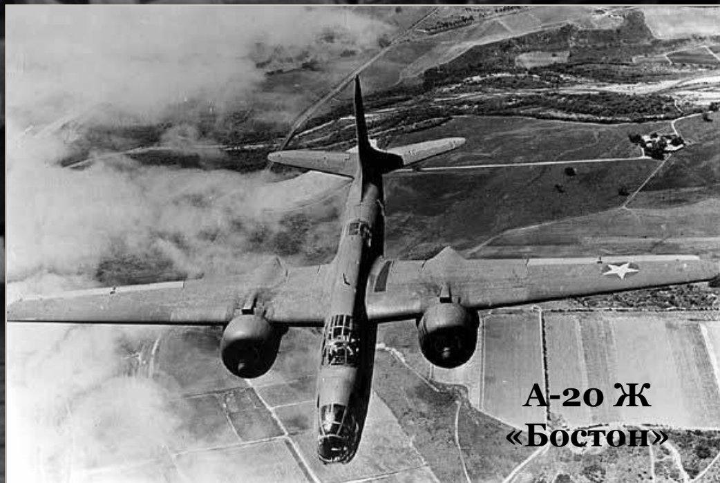
А-20 Ж «Бостон»