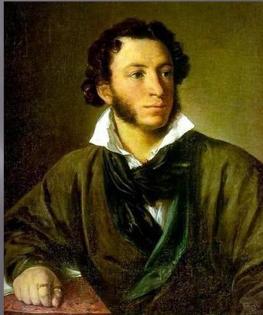
Александр Сергеевич Пушкин (1799 — 1837)