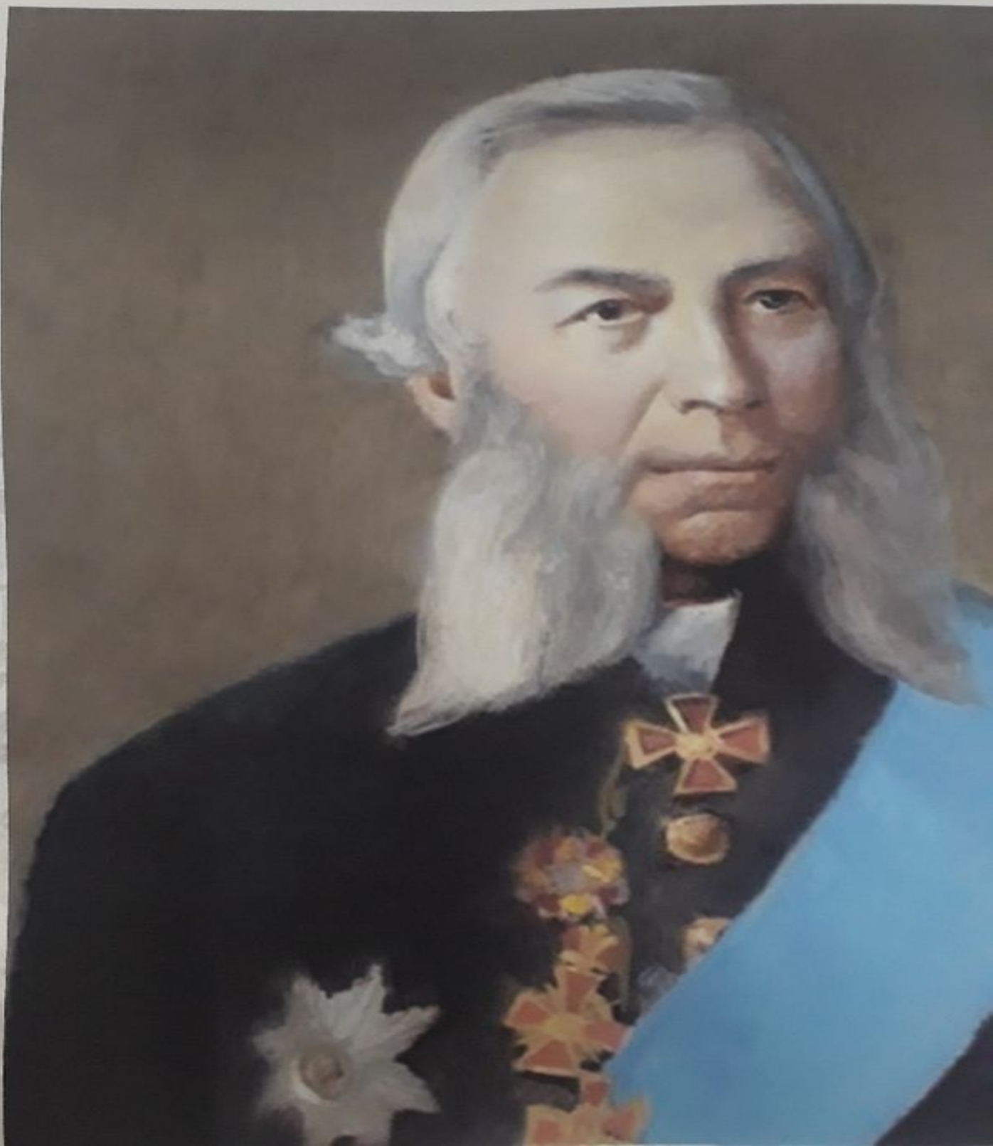
Иван Дмитриевич Путилин (1830 — 1893 гг.)