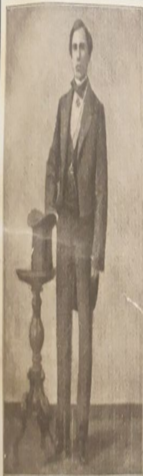
Иванъ Дмитріевичъ Путикинъ въ молодости.

Все свободное время молодой человек посвящает учебе, занимается самостоятельно, на свое небольшое жалование нанимает учителей.