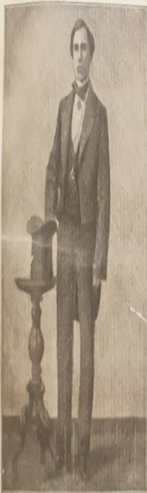
Иванъ Дмитріевичъ Путикинъ въ молодости.

Все свободное время молодой человек посвящает учебе, занимается самостоятельно, на свое небольшое жалование нанимает учителей.