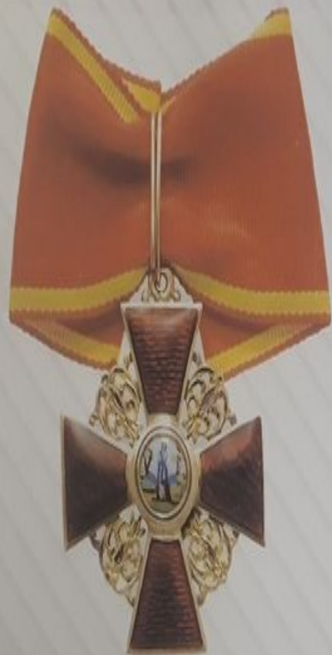
Орден Святой Анны 2-й степени