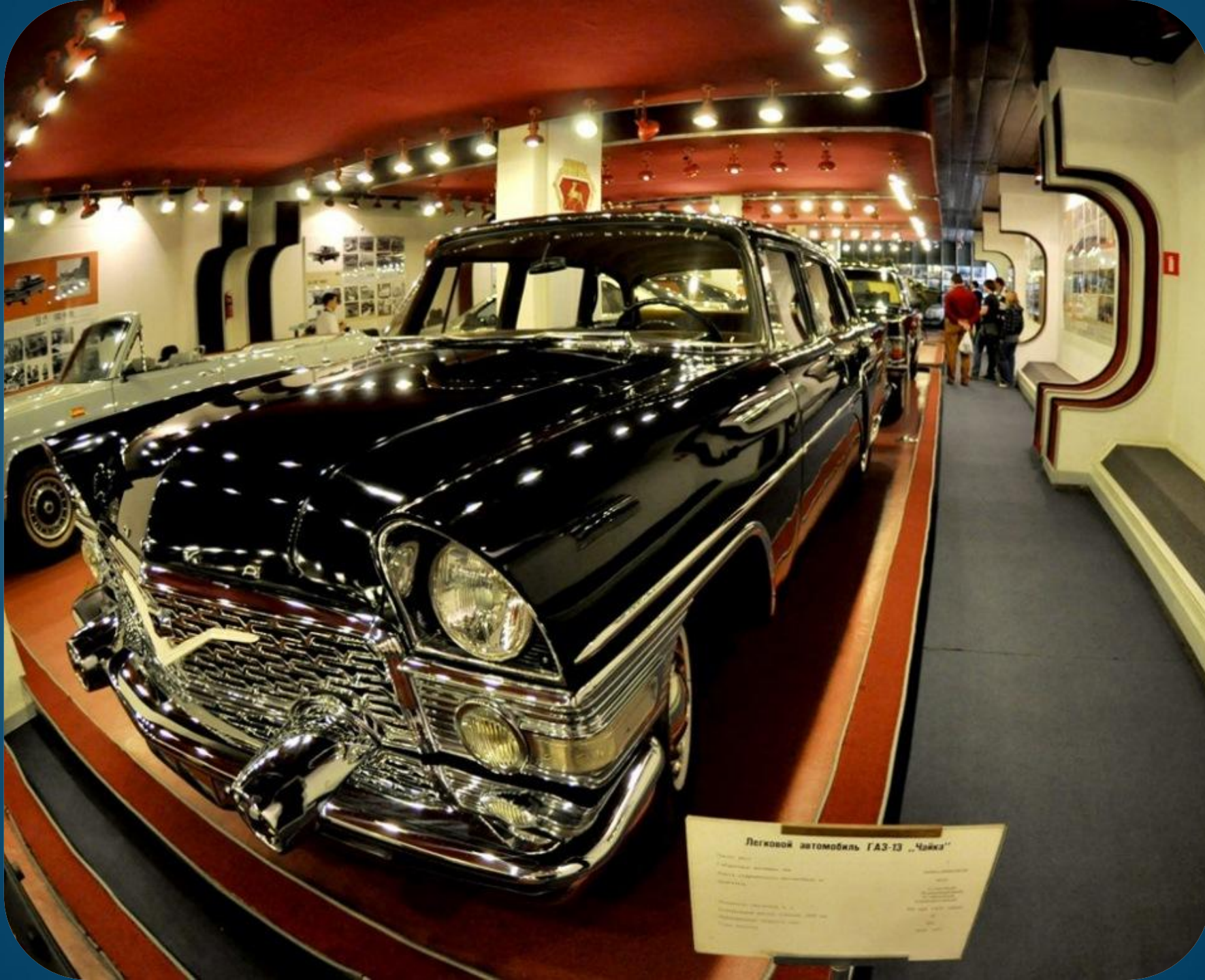
Легковой автомобиль ГАЗ-13 „Чайка“ Год выпуска: 1959-1968 Производитель: ГАЗ Тип двигателя: 4-цилиндровый, бензиновый Объем двигателя: 1,7 л Максимальная скорость: 130 км/ч Длина: 4,1 м Ширина: 1,6 м Высота: 1,4 м Масса: 1,2 т