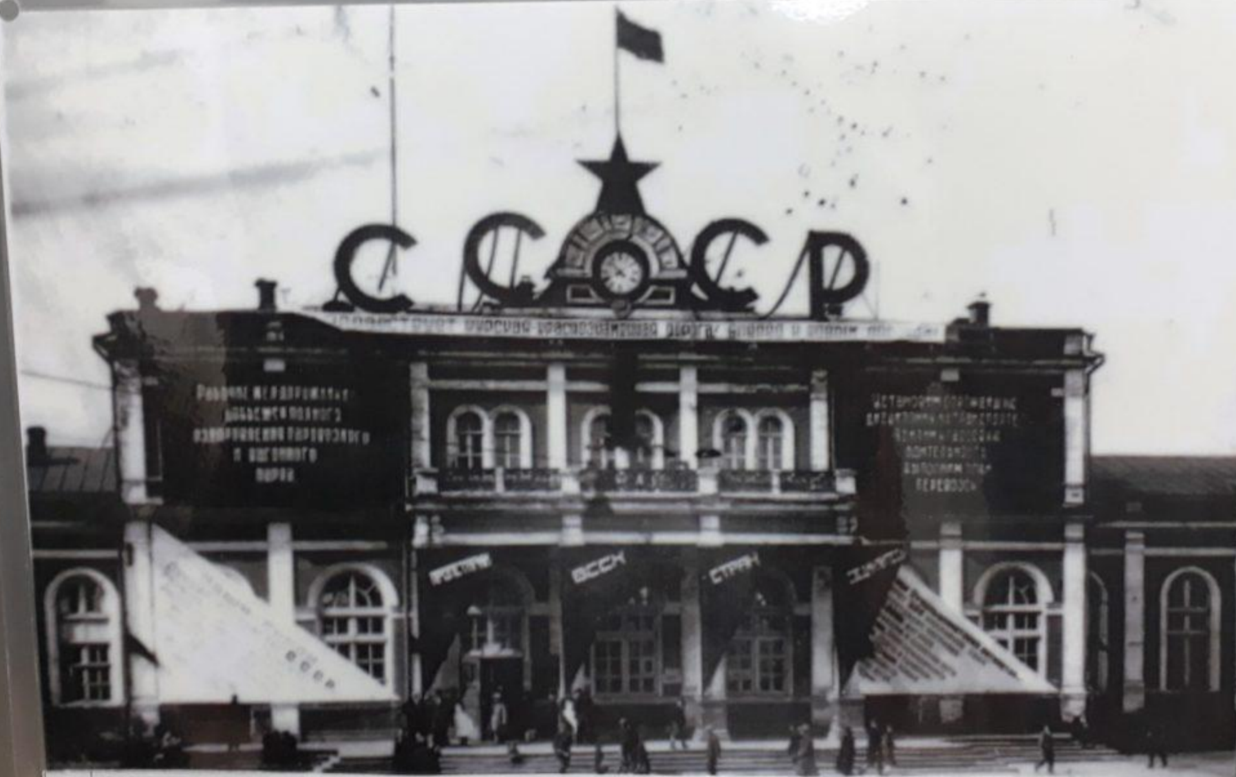
8 Московский вокзал в дни празднования годовщины Октябрьской революции