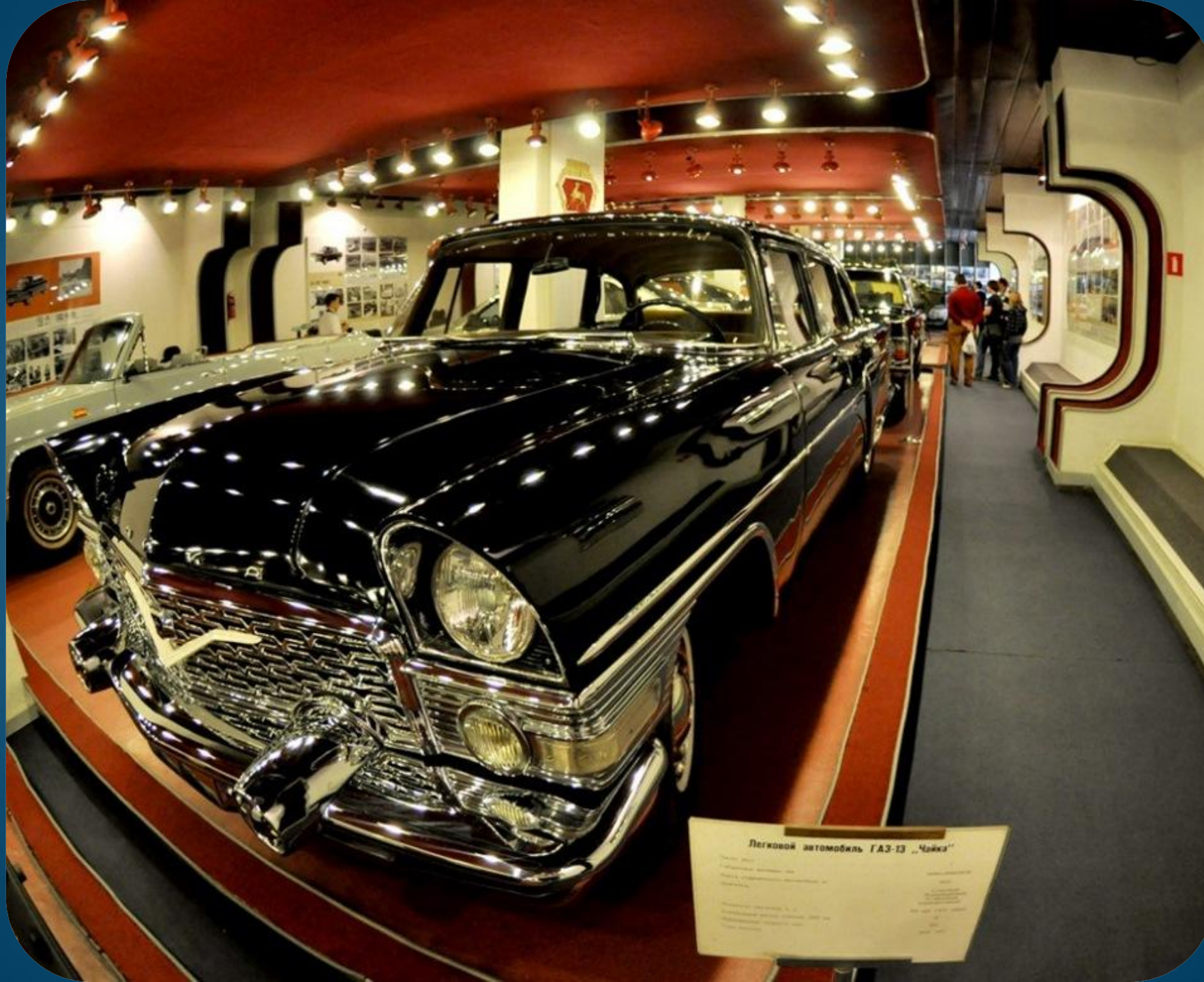
Легковой автомобиль ГАЗ-13 „Чайка“ Год выпуска: 1959-1968 Тип двигателя: 4-цилиндровый, бензиновый Мощность (кВт): 45 Максимальная скорость (км/ч): 140 Максимальная нагрузка (кг): 1000 Длина (мм): 4100 Ширина (мм): 1600 Высота (мм): 1450 База (мм): 2400 Колесная база (мм): 1400 Свес спереди (мм): 1000 Свес сзади (мм): 700 Клиренс (мм): 150 Среднее потребление топлива (л/100 км): 10 Объем багажного отделения (л): 150 Объем топливного бака (л): 40 Среднее потребление топлива (л/100 км): 10 Объем багажного отделения (л): 150 Объем топливного бака (л): 40