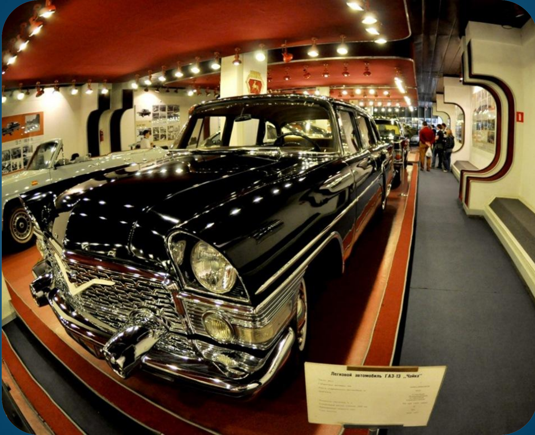
Легковой автомобиль ГАЗ-13 „Чайка“ Год выпуска: 1959-1968 Производитель: ГАЗ Тип двигателя: 4-цилиндровый, бензиновый Объем двигателя: 1,8 л Максимальная скорость: 140 км/ч Длина: 4,2 м Ширина: 1,6 м Высота: 1,4 м Масса: 1,2 т