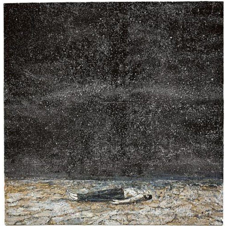
«Заказы ночи», 1977