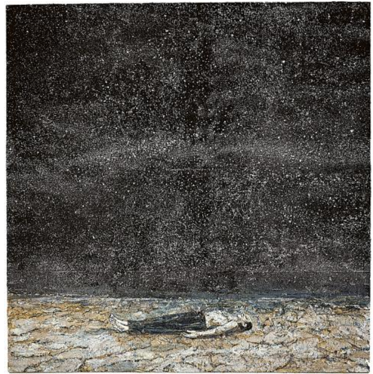
«Заказы ночи», 1977