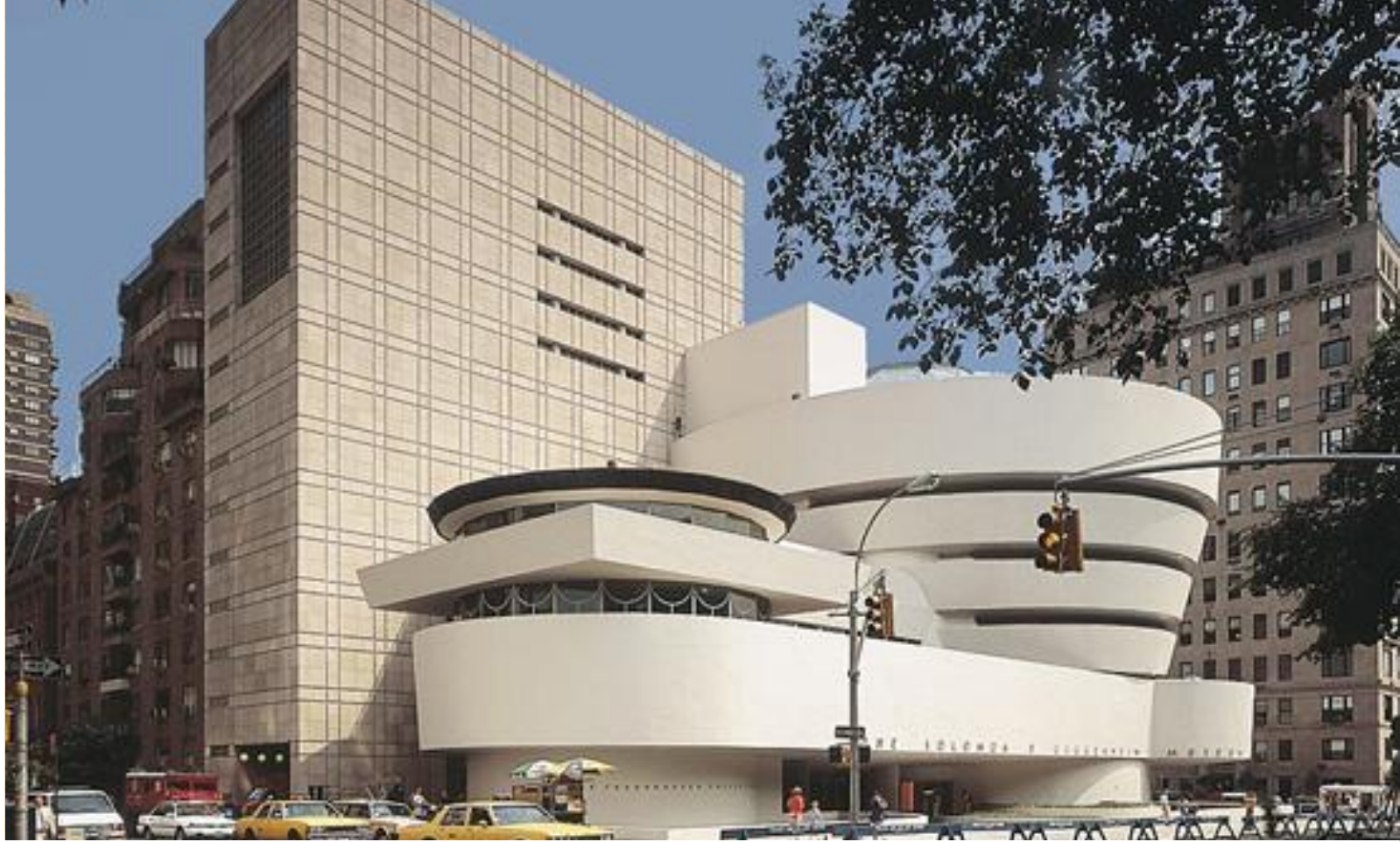
Музей Соломона Гуггенхайма в Нью-Йорке