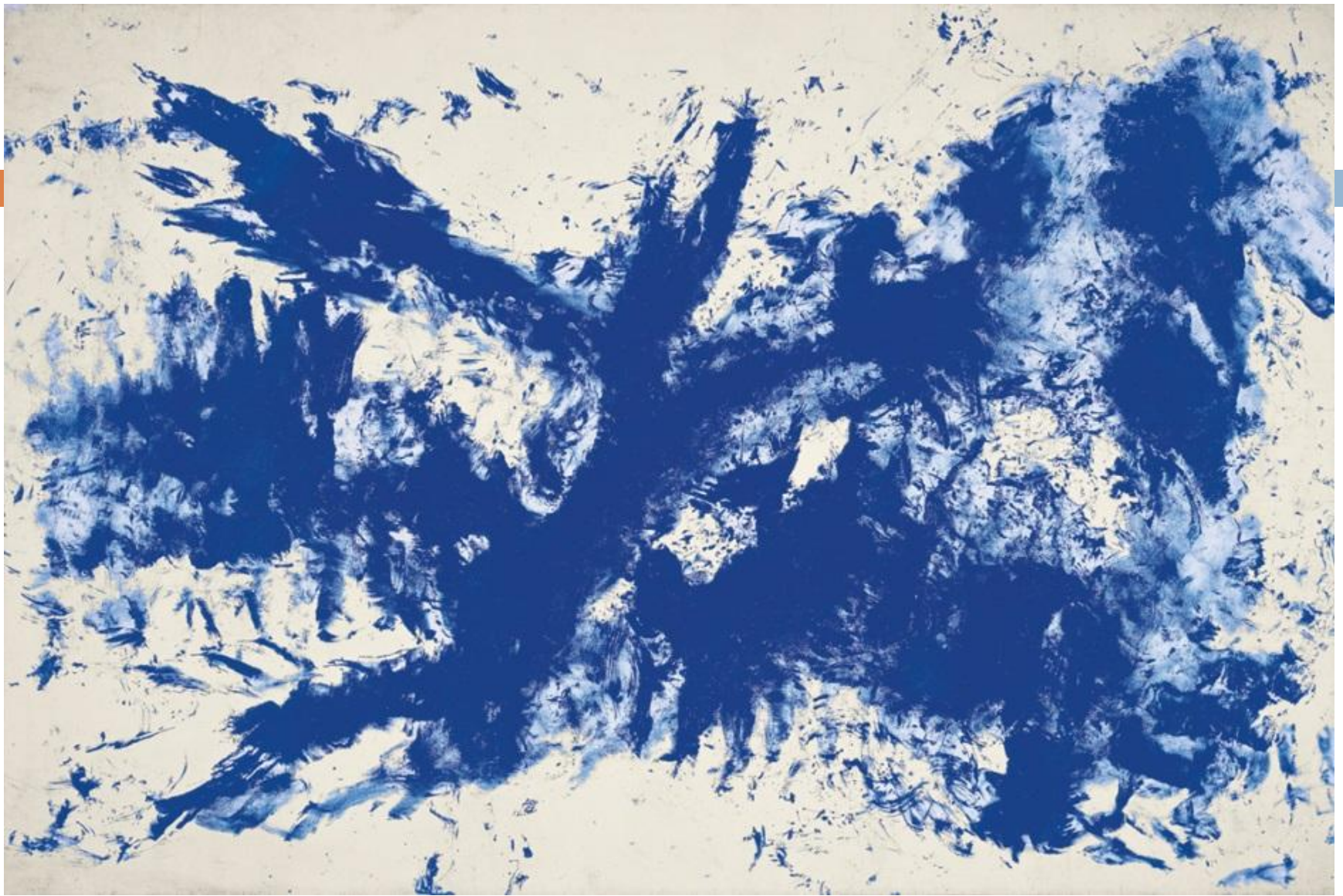
Одна из антропометрий, 1961