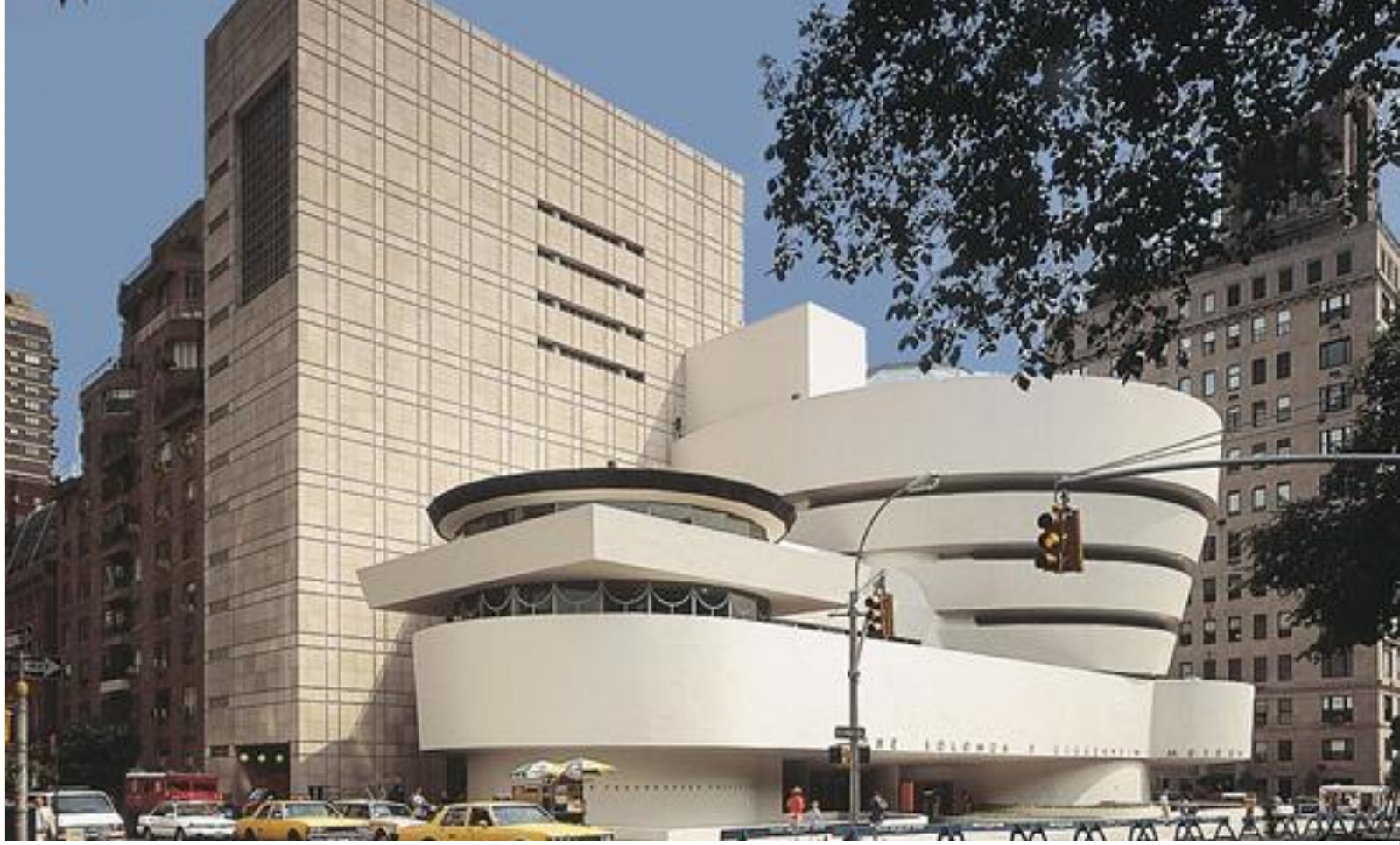
Музей Соломона Гуггенхайма в Нью-Йорке