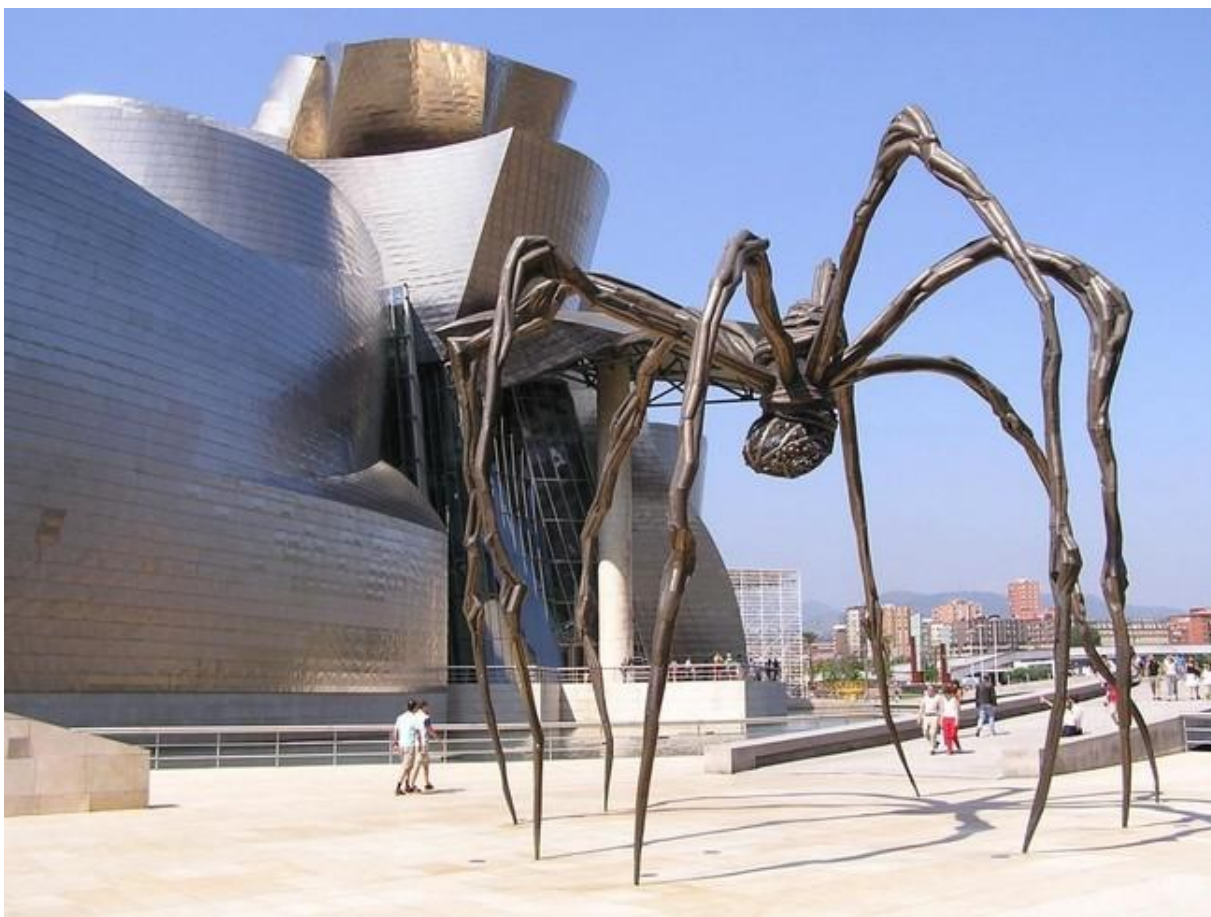
□ «Маман», 1999