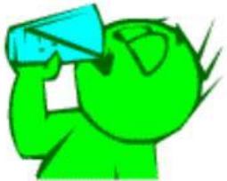
He is drinking.