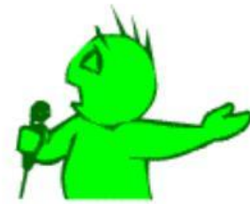
He is singing.