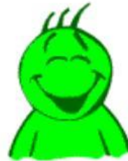
He is smiling.