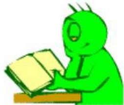
He is reading.