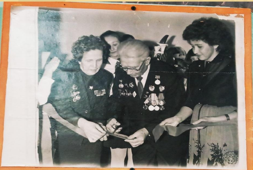
ОТКРЫТИЕ ШКОЛЬНОГО МУЗЕЯ 586 ИАП