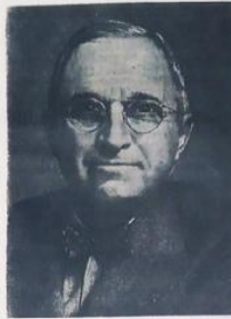
Президент США Г. Труман.