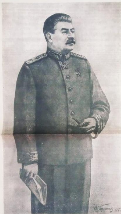
И. В. Сталин.

Вчера наш великий народ, народ-победитель праздновал день полного торжества своего правого дела. До здравствует великий организатор и вдохновитель исторической победы советского народа над германским империализмом — наш любимый вождь и учитель товарищ Сталин!