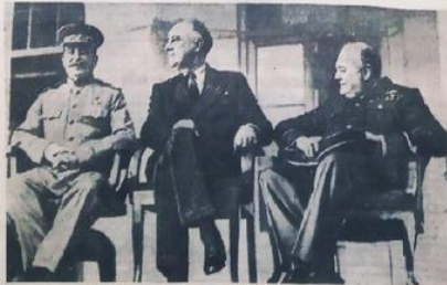
И. В. Сталин, Ф. Д. Рузвельт и У. Черчилль в дни Тегеранской конференции.

С победой вас, мои дорогие соотечественники и соотечественницы! СЛАВА НАШЕЙ ГЕРОИЧЕСКОЙ КРАСНОЙ АРМИИ, ОТПРАВЛЯВШЕЙ НЕЗАВИСИМОСТЬ НАШЕЙ РОДИНЫ И ЗАВОВАВШЕЙ ПЕБУДУ НАД ВРАГОМ! СЛАВА НАШЕМУ ВЕЛИКОМУ НАРОДУ, НАРОДУ-ПОБЕДИТЕЛЮ! ВЕЧНАЯ СЛАВА ГЕРОЯМ, ПАВШИМ В БОЯХ С ВРАГОМ И ОТДАВШИМ СВОЮ ЖИЗНЬ ЗА СВОБОДУ И СЧАСТЬЕ НАШЕГО НАРОДА!