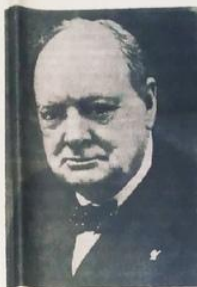
Премьер-министр Великобритании У. Черчилль.