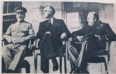
И. В. Сталин, Ф. Д. Рузвельт и У. Черчилль в дни Тегеранской конференции.

С победой вас, мои дорогие соотечественники и соотечественницы! СЛАВА НАШЕЙ ГЕРОИЧЕСКОЙ КРАСНОЙ АРМИИ, ОТПРАВЛЯВШЕЙ НЕЗАВИСИМОСТЬ НАШЕЙ РОДИНЫ И ЗАВОВАВШЕЙ ПЕБУДУ НАД ВРАГОМ! СЛАВА НАШЕМУ ВЕЛИКОМУ НАРОДУ, НАРОДУ-ПОБЕДИТЕЛЮ! ВЕЧНАЯ СЛАВА ГЕРОЯМ, ПАВШИМ В БОЯХ С ВРАГОМ И ОТДАВШИМ СВОЮ ЖИЗНЬ ЗА СВОБОДУ И СЧАСТЬЕ НАШЕГО НАРОДА!