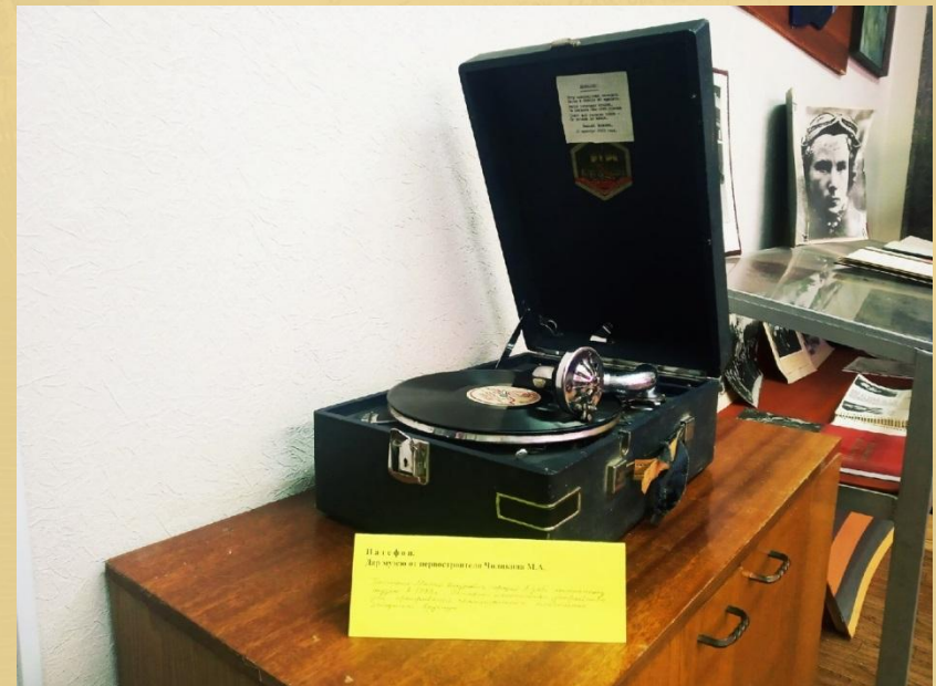
Патефон. Это патефон принадлежал в Чкаловск М.А. (дальше текст нечитаем)