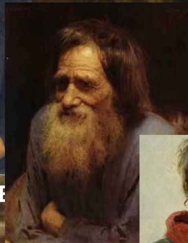
И. Крамской Конец XIX в.