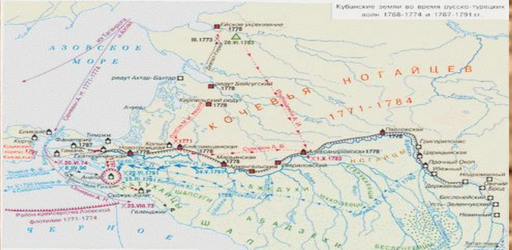
Кубанские земли во время русско-турецких войн: 1768-1774 и 1787-1791 гг.