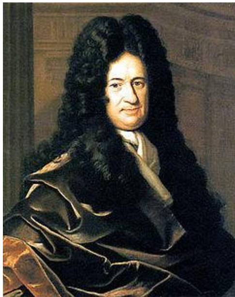
Г.В. Лейбниц (1646 - 1716)

Логистика - символическая логика, новейшая разновидность формалистической логики.