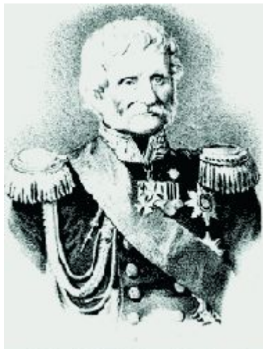
А.А. Жомини (1779-1869 гг.)

Логистика - практическое искусство управления войсками, включающее широкий круг вопросов, связанных с планированием, управлением и снабжением, определением мест дислокации войск, транспортным обслуживанием армии и т.п.