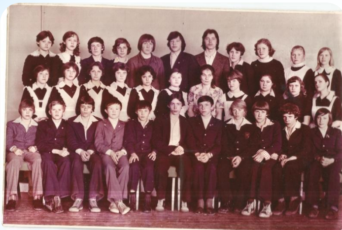
САДТ весна 1981год