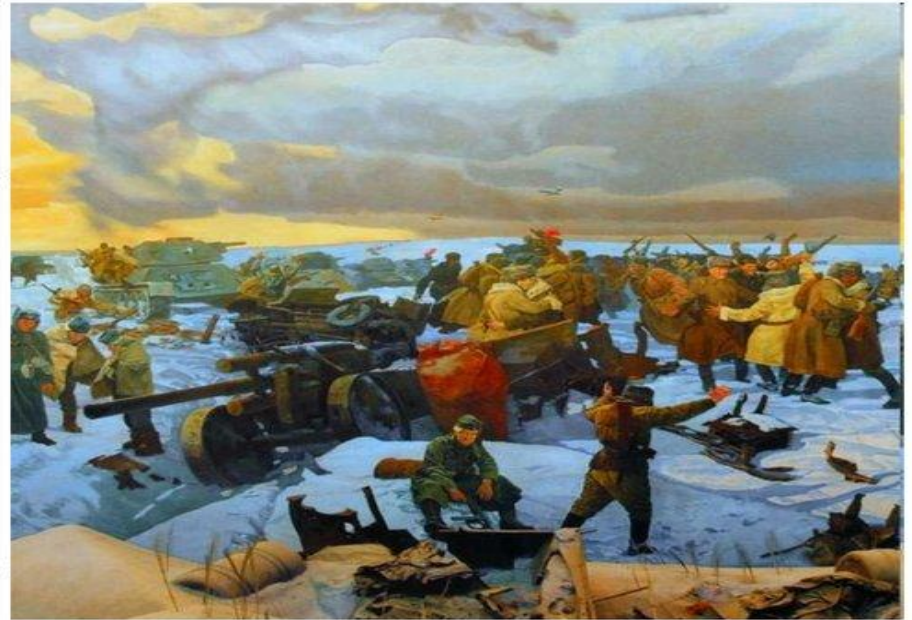
Сталинградская битва. Соединение фронтов

Попытки немцев выйти из окружения оказались неудачными