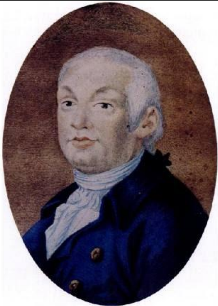
Vincenzo Chiarugi, 1759–1820

Психопатология возникла в результате изучения отдельных заболеваний, обобщения данных этого изучения. Она зародилась в конце XVIII века в учении о психических болезнях итальянского психиатра Киаруджи, первым высказавшего мысль о едином психозе. В концепции единого психоза содержится обобщение закономерностей, свойственных отдельным психическим заболеваниям. В исследованиях Пинеля, Эскиродя, Пелена, Фридрейха содержалось дальнейшее развитие общего учения о психических болезнях, но в их исследованиях акцент делался на симптоматологии.