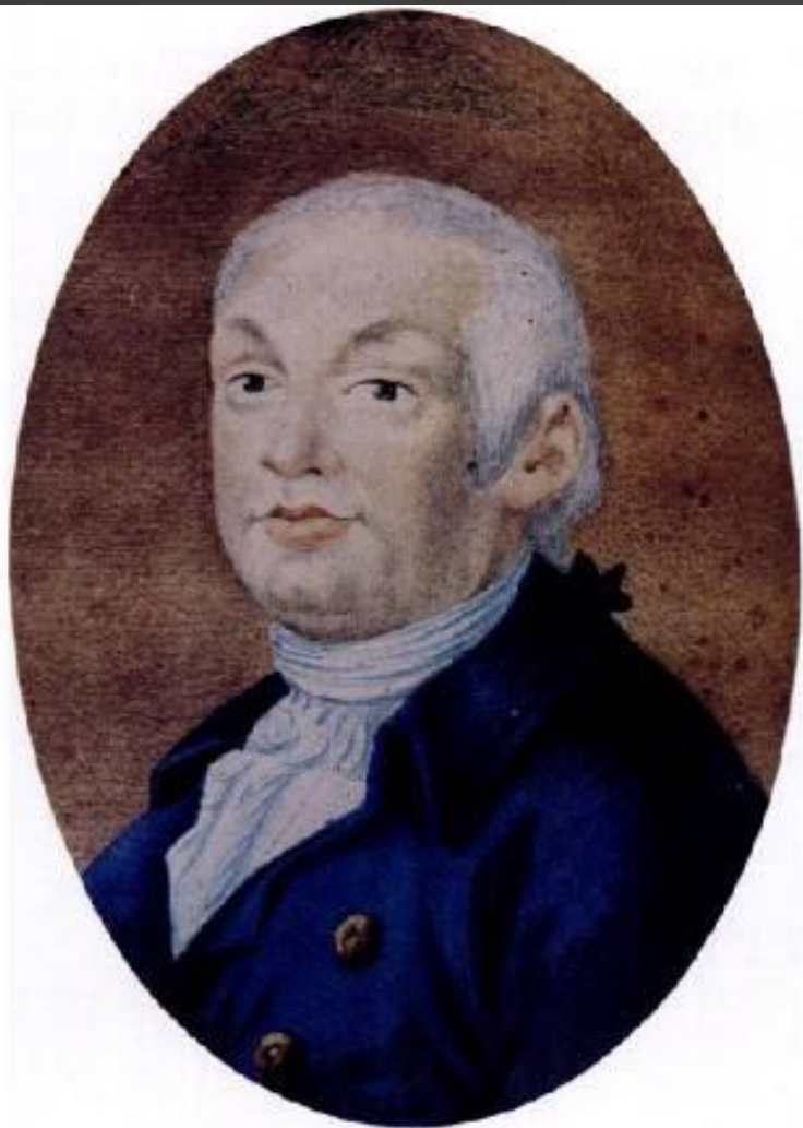
Vincenzo Chiarugi, 1759–1820

Психопатология возникла в результате изучения отдельных заболеваний, обобщения данных этого изучения. Она зародилась в конце XVIII века в учении о психических болезнях итальянского психиатра Киаруджи, первым высказавшего мысль о едином психозе. В концепции единого психоза содержится обобщение закономерностей, свойственных отдельным психическим заболеваниям. В исследованиях Пинеля, Эскиродя, Пелена, Фридрейха содержалось дальнейшее развитие общего учения о психических болезнях, но в их исследованиях акцент делался на симптоматологии.